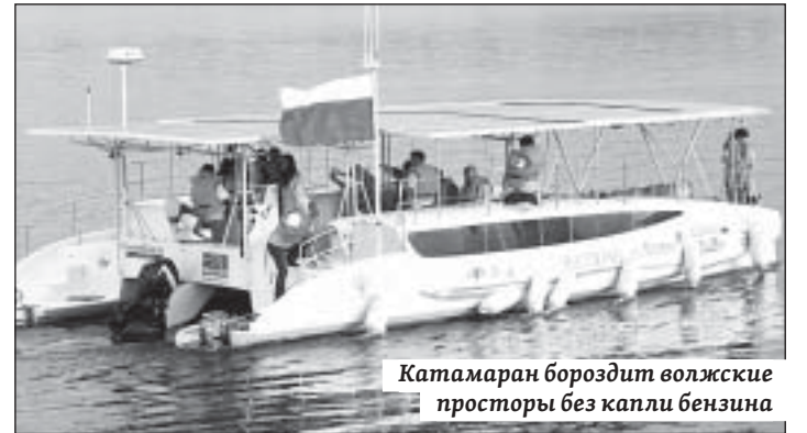
Катамаран бороздит волжские просторы без капли бензина