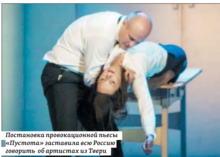
Постановка провокационной пьесы «Пустота» заставила всю Россию говорить об артистах из Твери

не каждый день, а два-три раза в неделю. Популярность была очень велика, огромные очереди, билеты выменивались на хлеб, конфеты, американскую тушенку из офицерских пайков. Театр оперетты превратился для определенной части саратовцев в своеобразный клуб, где можно было отдохнуть, расслабиться, приятно провести свободное время, которого выпадало немного. И вот вся эта публика встала стеной и решила не уступать.