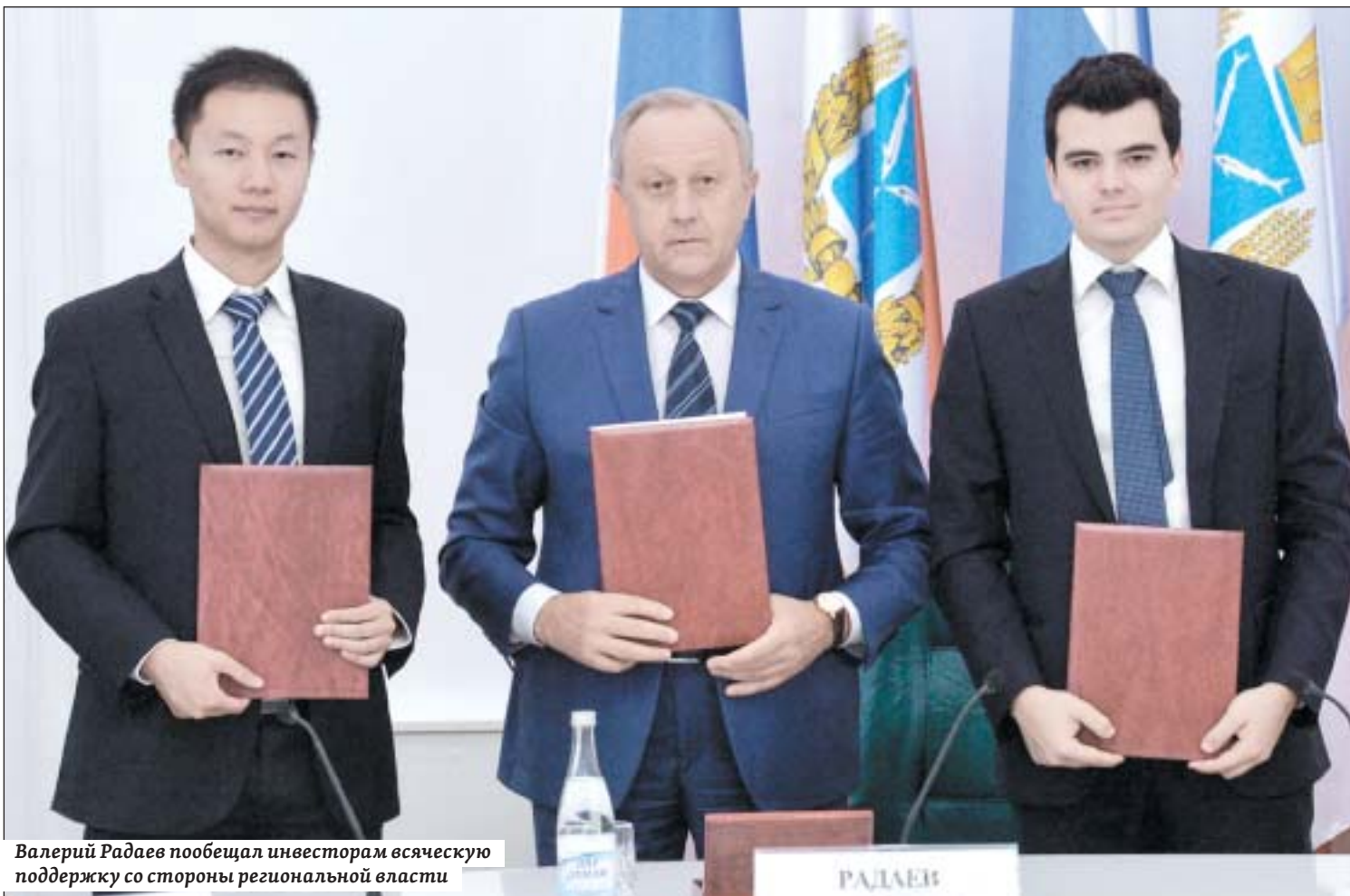
Валерий Радаев пообещал инвесторам всяческую поддержку со стороны региональной власти

Олег ТРИГОРИН