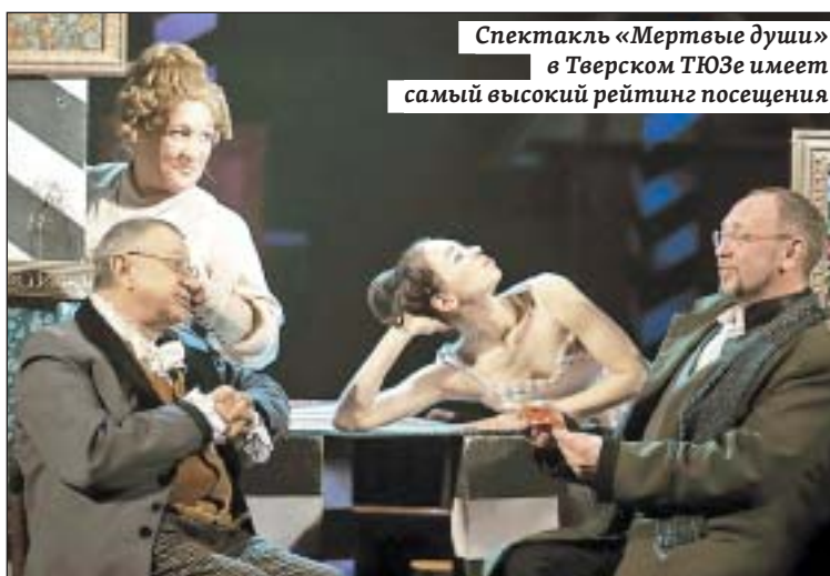
Спектакль «Мертвые души» в Тверском ТЮЗе имеет самый высокий рейтинг посещения

Потом выяснилось, что это был художественный руководитель и директор театра оперетты Сологуб. Надо сказать, что при своей экстравагантности он был человеком многогранным, интересным, видимо, даровитым. В состав этого коллектива входило много значительных молодых актеров. Они играли