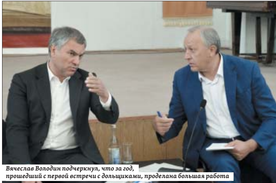
Вячеслав Володин подчеркнул, что за год, прошедший с первой встречи с дольщиками, проделана большая работа