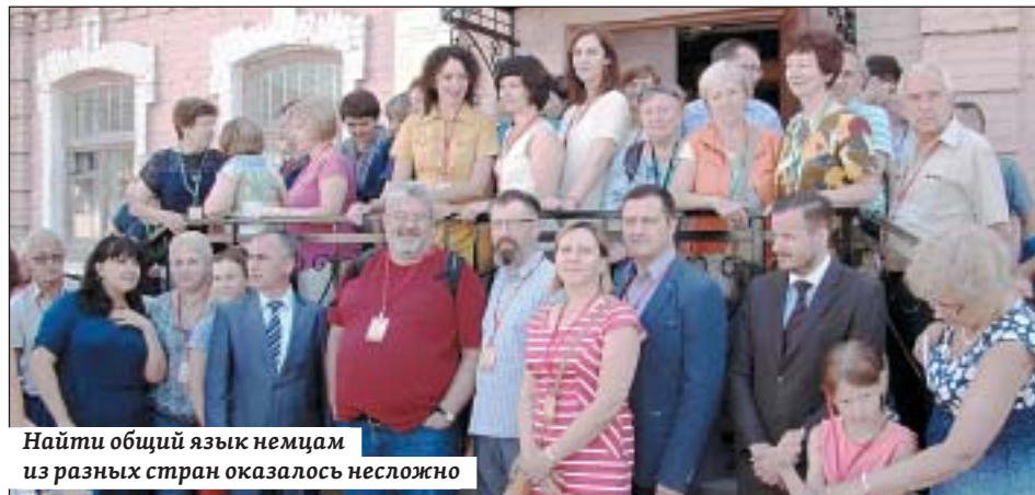
Найти общий язык немцам из разных стран оказалось несложно

В Саратовской области с 12 по 19 августа проходят мероприятия, приуроченные к 100-летию образования Автономной области немцев Поволжья. В Марксе 15 августа состоялась XVII Международная научная конференция «Российские немцы: от национально-территориальной автономии – к современной системе самоорганизации. Исторический опыт длиной 100 лет».