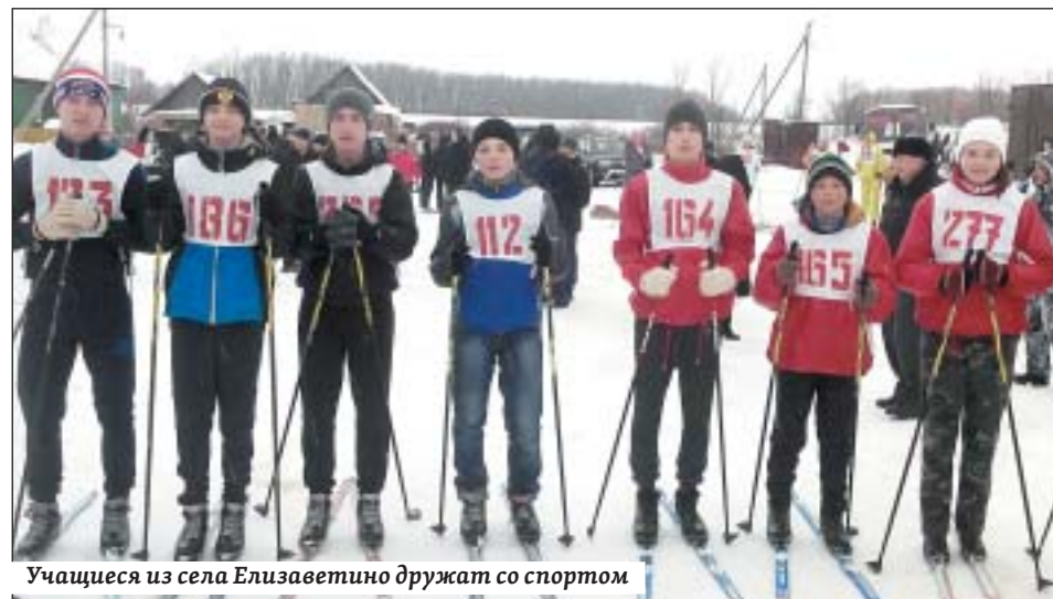
Учащиеся из села Елизаветино дружат со спортом

■ Иван ПОСПЕЛОВ, по материалам пресс-службы министерства образования области