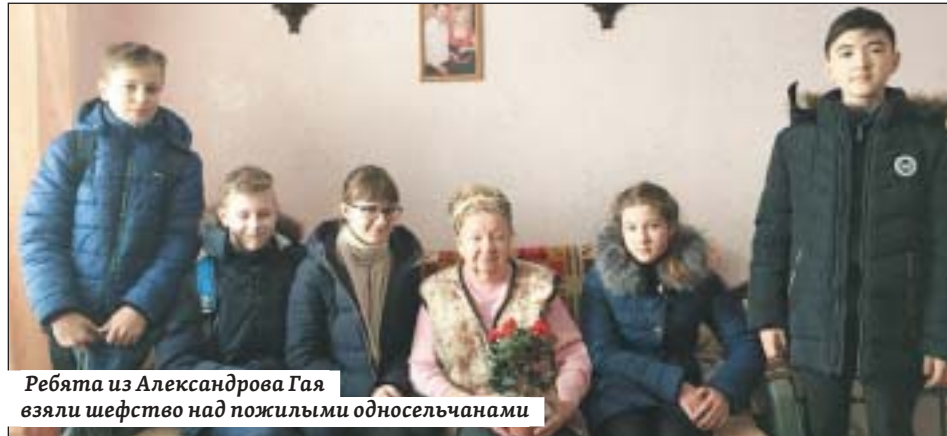
Ребята из Александрова Гая взяли шефство над пожилыми односельчанами

Региональная комиссия конкурса определила 12 классных коллективов-победителей и 126 классов-призеров. Лучшие классы из Александрово-Гайского, Аткарского, Базарно-Карабулакского,