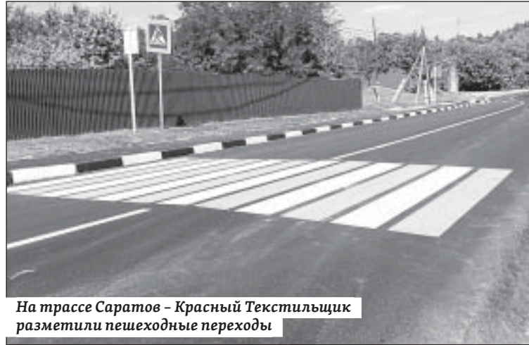
На трассе Саратов – Красный Текстильщик разметили пешеходные переходы

– В соответствии с условиями контракта верхний слой должен быть не менее 5 см. Мы провели контрольные рубки, чтобы