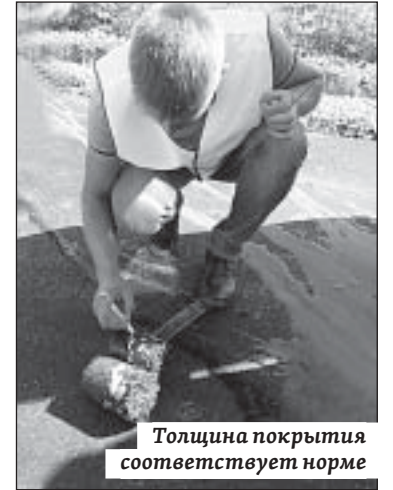
Толщина покрытия соответствует норме

зафиксировать толщину уложенного покрытия. В результате замера толщина покрытия оказалась от 5,5 до 6 см, то есть выше параметра, предусмотренного контрактом. Однако окончательное заключение о соответствии асфальтобетона дадим только после всех лабораторных испытаний. Будут проведены также испытания на его прочность и водонаполнение, другие исследования. Но к толщине уложенного покрытия вопросов нет, – заявил эксперт.