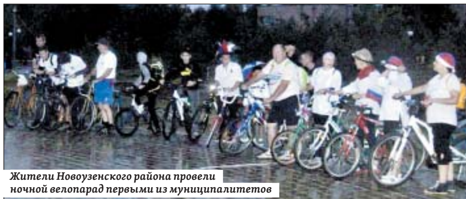
Жители Новоузенского района провели ночной велопарад первыми из муниципалитетов

– Все прошло замечательно, без травм и падений! Всем понравилось, ведь очень многие впервые увидели наш ночной город с колес велосипеда, да еще в колонне и при сопровождении машин Госавтоинспекции. Это сильно впечатлило и воодушевило! Отмечу особенно организованное сопровождение