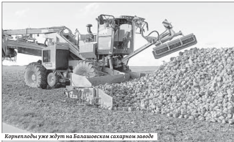
Корнеплоды уже ждут на Балашовском сахарном заводе