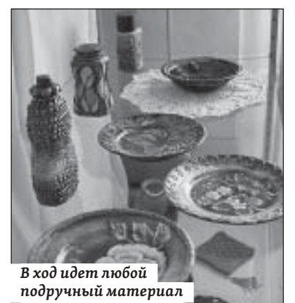
В ход идет любой подручный материал