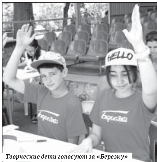
Творческие дети голосуют за «Березку»

отдыха, оздоровления и занятости по сравнению с 2017 годом на 2 тысячи детей, – заявила Бузилова.