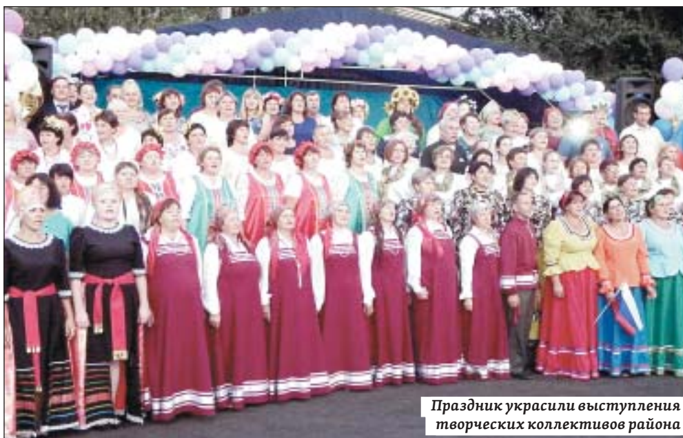
Праздник украсили выступления творческих коллективов района

в подготовке юбилейного издания «Уникальный уголок России», посвященного истории и уникальным местам Романовского района.