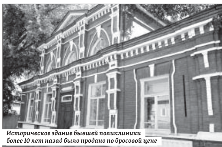
Историческое здание бывшей поликлиники более 10 лет назад было продано по бросовой цене

«В том же Вольске реализуется ряд проектов при поддержке Вячеслава Викторовича Володина. Он ищет спонсорские средства, которые позволяют расширять проблемы людей, в то время как муниципальная власть не использует в полной мере возможности своего бюджета для решения вопросов. По сложившейся ситуации вывод только один – проданные участки должны быть возвращены в муниципальную, и один из них – в областную собственность. Требую исполнить