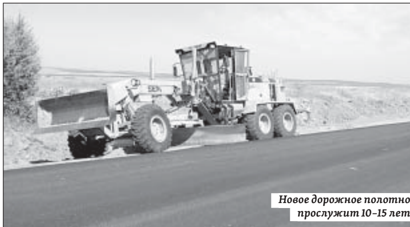
Новое дорожное полотно прослужит 10–15 лет