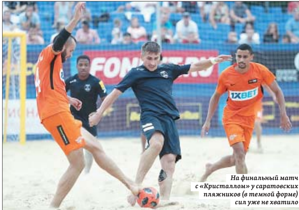
На финальный матч с «Кристаллом» у саратовских пляжников (в темной форме) сил уже не хватило

– Мы все играли с большим удовольствием, с полной самоотдачей, выложились на 100 процентов. Серебряные медали – это наш успех, но далеко не предел. Думаю, если бы мы играли в полном составе, могли бы побороться за первое место. Но у нас