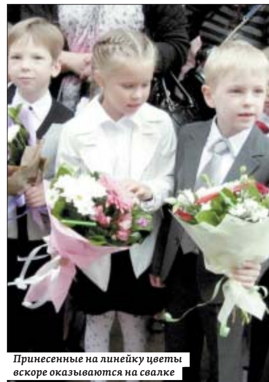
Принесенные на линейку цветы вскоре оказываются на свалке

– Лыжи буду новые покупать, хочется, чтобы не «дрова» какие-нибудь были, а современные. Вообще люблю двигаться, дарить телу мышечную радость, – добавляет ветеран труда. – В планах уехать к дочери, помогать воспитывать внука. Но пока очень сложно представить, что мне не нужно будет идти на работу, а заниматься только домашними делами!