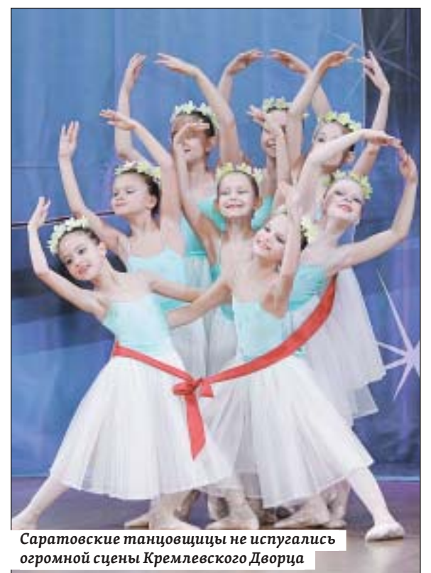
Саратовские танцовщицы не испугались огромной сцены Кремлевского Дворца