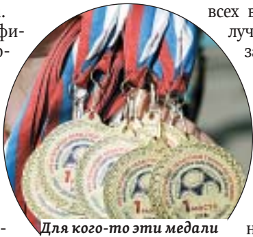
Для кого-то эти медали стали первыми наградами в жизни

Поздравляя финалистов, губернатор отметил, что в этом году команды боролись за звание победителей, вдохновленные успехами российской сборной на чемпионате мира по футболу.