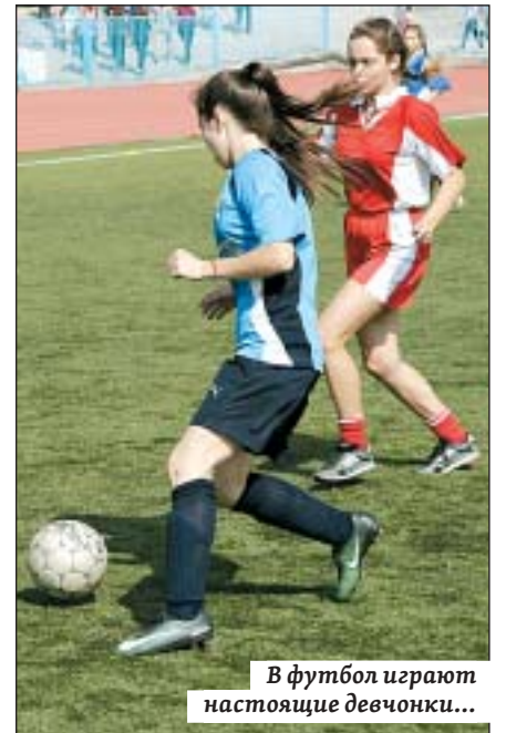
В футбол играют настоящие девчонки...

« У нас своеобразный рекорд – в соревнованиях на Кубок губернатора приняли участие сразу четыре команды девочек. И все четыре – в призах: два вторых и два третьих места,