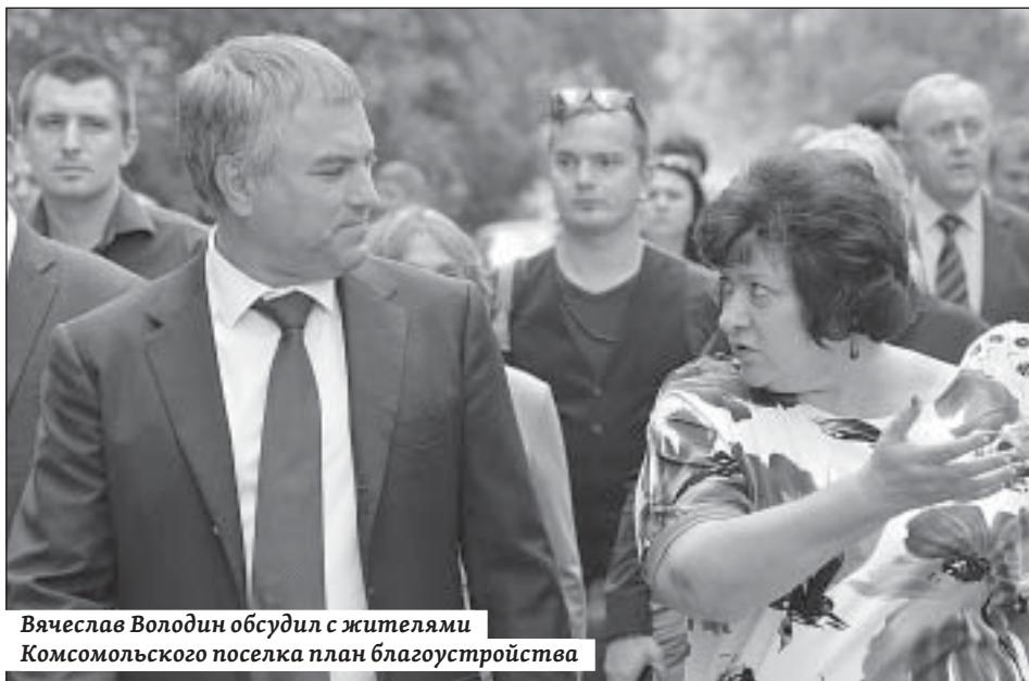
Вячеслав Володин обсудил с жителями Комсомольского поселка план благоустройства

– В том, что стадион привели в такое полуразрушенное состояние, – есть прямой умысел, чтобы отдать объект под застройку, как это уже, к сожалению, не-