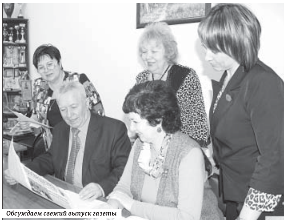
Обсуждаем свежий выпуск газеты