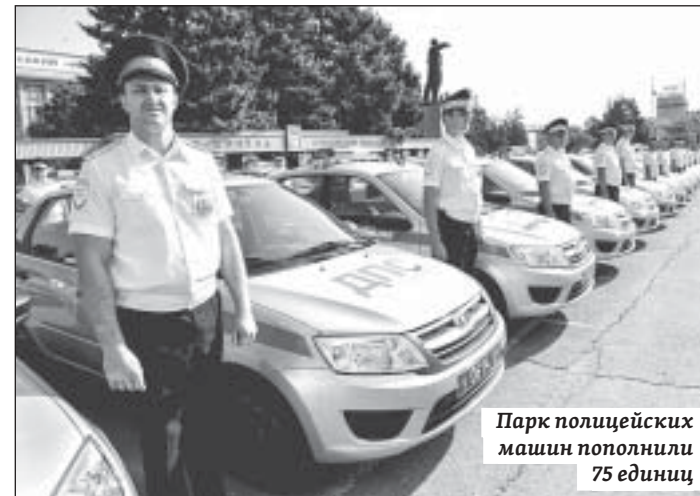
Парк полицейских машин пополнили 75 единиц

Радаев, начальник Главного управления МВД России по Саратовской области генерал-майор полиции Николай Грифонов.