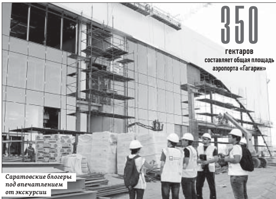
Саратовские блогеры под впечатлением от экскурсии

На привокзальную площадь сейчас доставляются материалы для устройства дорог и парковок, прокладываются инженерные сети.