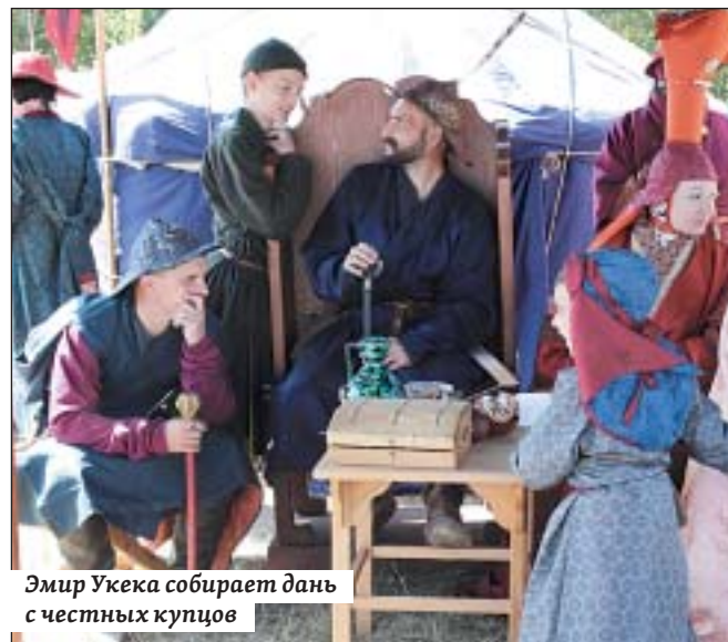
Эмир Укека собирает дань с честных купцов

Садись за бочарный круг, бери в руки молот – узнай, каково быть подмастерьем.