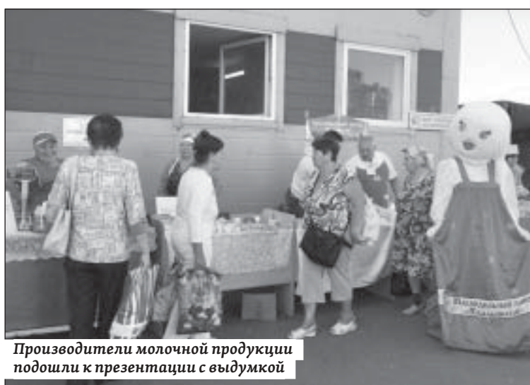
Производители молочной продукции подошли к презентации с выдумкой

Первые партии этой сладкой продукции местного производства уже поступили в