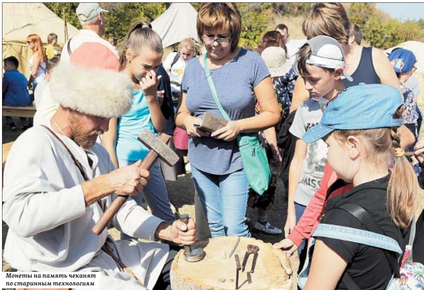
Монеты на память чеканят по старинным технологиям