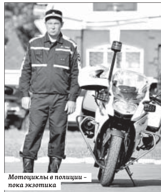
Мотоциклы в полиции – пока экзотика

Отъезд техники с Театральной площади напоминал парад. Открыли движение мотоциклисты. За ними парами тронулись оперативные «Лады», «ГАЗели», спецавтомобили УАЗ. Легкая полицейская служба теперь будет еще результативнее.