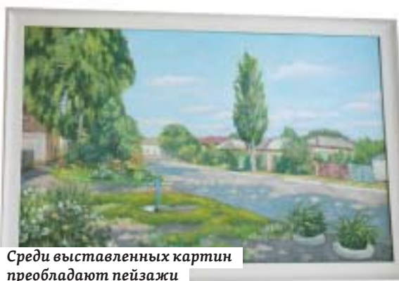
Среди выставленных картин преобладают пейзажи