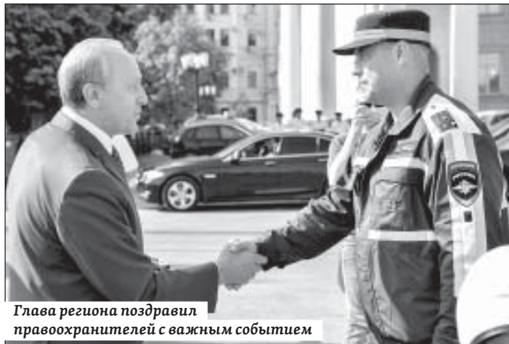
Глава региона поздравил правоохранителей с важным событием