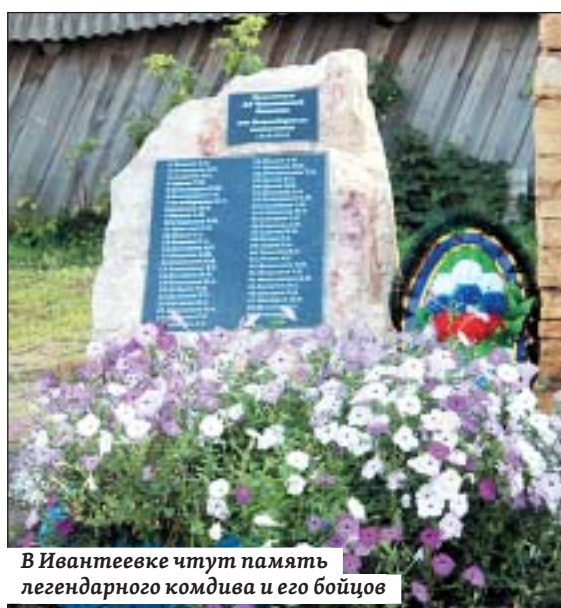
В Ивантеевке чтут память легендарного комдива и его бойцов

Центральным событием станет юбилейный вечер-спектакль 4 октября. Но для зрителей 100-летие – это новые спектакли, яркие актерские работы, неожиданные режиссерские решения, то есть праздник каждый вечер.