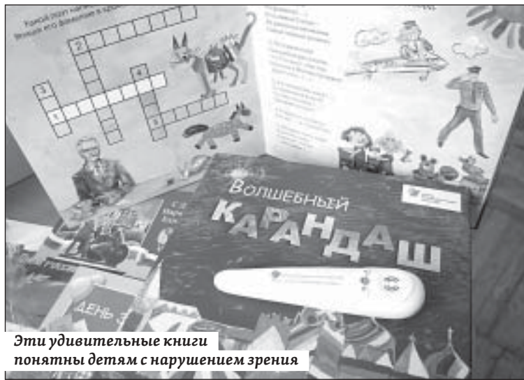
Эти удивительные книги понятны детям с нарушением зрения

К книге прилагается гаджет – электронное устройство «Волшебный карандаш», с помощью которого ребята могут послушать слова и мелодию гимна, познакомиться с шедеврами русских композиторов Чайковского, Мусоргского, Глинки, Свиридова.