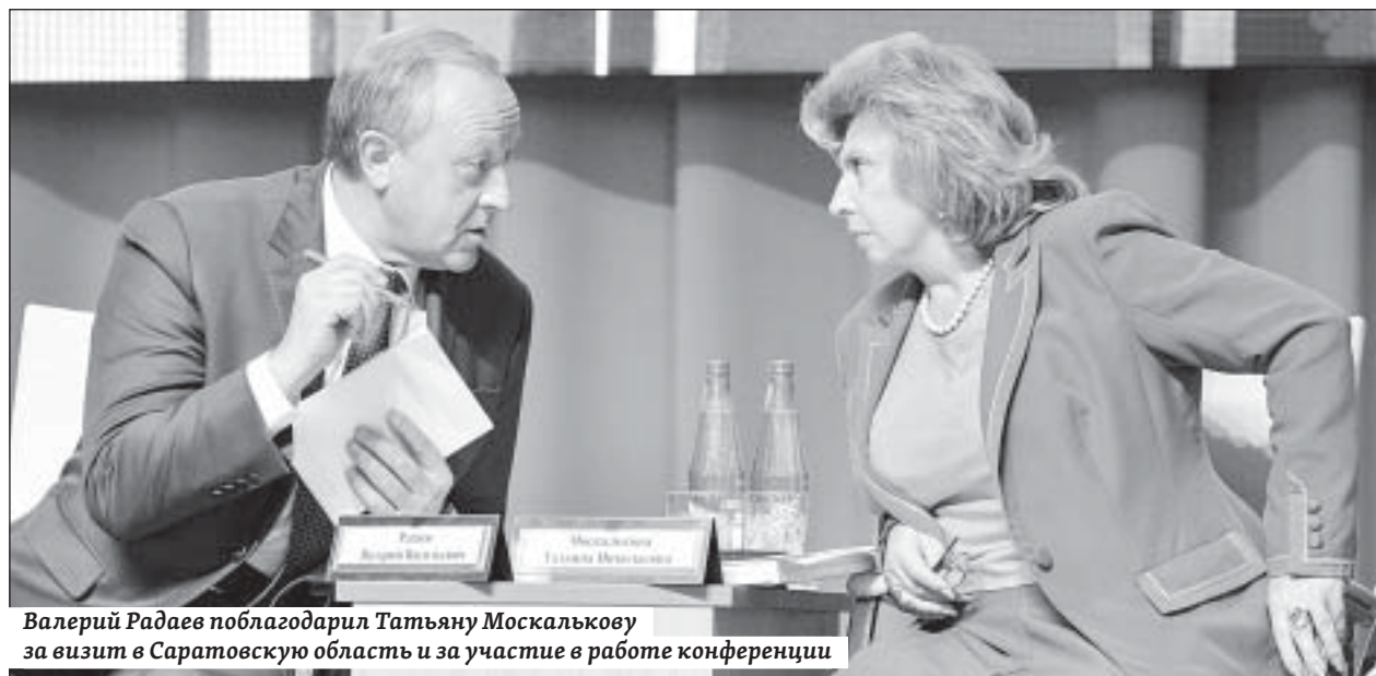
Валерий Радаев поблагодарил Татьяну Москалькову за визит в Саратовскую область и за участие в работе конференции