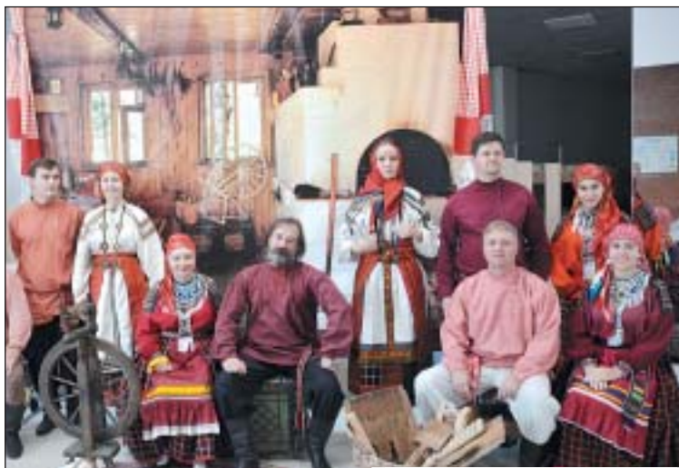
Народному укладу посвящены многие разделы выставки

Началась гражданская война, разруха, погибли миллионы людей.