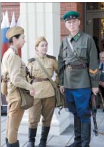
Военная эпоха представлена в экспозиции и в реконструкции