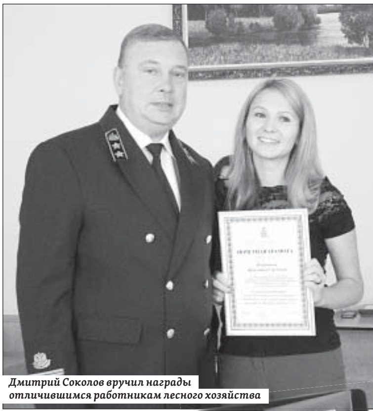
Дмитрий Соколов вручил награды отличившимся работникам лесного хозяйства

Министр выразил надежду, что все проблемы, которые сегодня остро испытывает лесное хозяйство в регионах, будут решены при государственной поддержке.