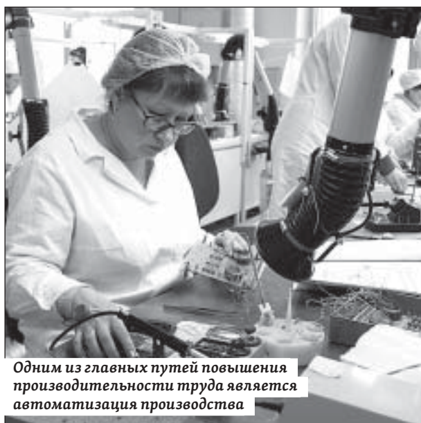
Одним из главных путей повышения производительности труда является автоматизация производства

– По сути да. Но! Важная задача ФЦК – это, в первую очередь, формирование интереса бизнеса к проблеме роста производительности труда и создание профильного рынка услуг. И, естественно, как вы предполагаете, мы должны создать условия для разворачивания