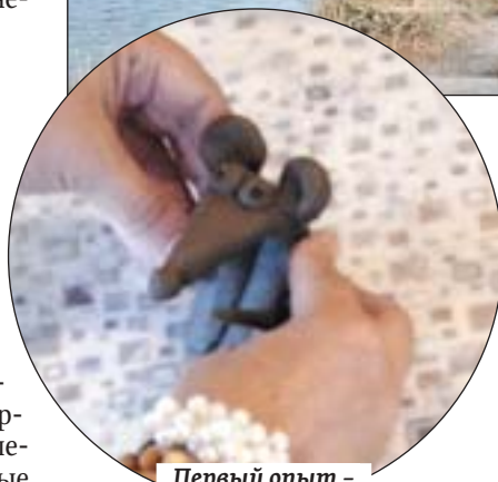
Первый опыт – вполне удачный

лов, – поделился информацией наш постоянный автор, краевед Денис Жабкин.