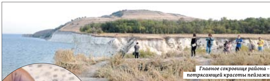
Главное сокровище района – потрясающей красоты пейзажи