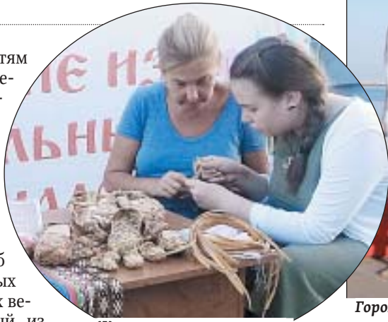
Желающие участвовали в различных мастер-классах

На фестивальной площадке выступили народный ансамбль