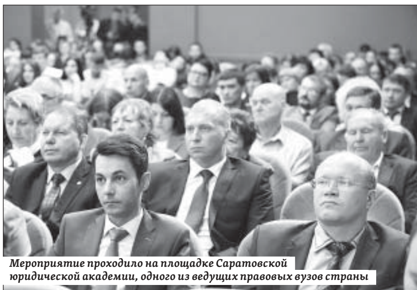
Мероприятие проходило на площадке Саратовской юридической академии, одного из ведущих правовых вузов страны

– Мы знаем, как непросто было создать основу института уполномоченного по правам человека два десятка лет назад. И сегодня я хочу поблагодарить всех, кто стоял у истоков этого великого дела – защиты прав человека. Хочу поздра-