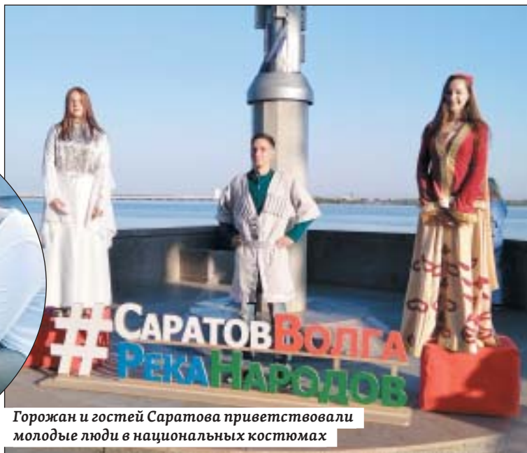
Горожан и гостей Саратова приветствовали молодые люди в национальных костюмах

Горожан и гостей Саратова приветствовали артисты на ходулях в национальных костюмах, живые скульптуры. Гостеприимно встречали посетителей в русском, казахском, татарском, немецком, еврейском, чеченском, корейском и китайском национальных подворьях. Например, на русском подворье заведующий отделом городского Дома культуры на-