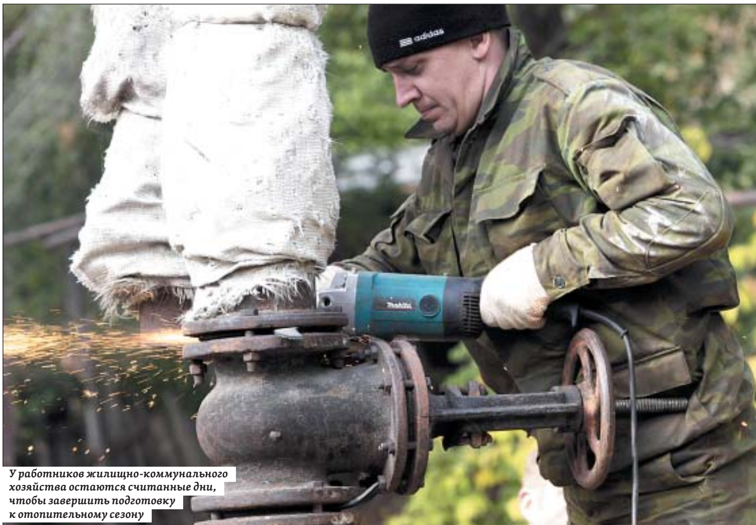
У работников жилищно-коммунального хозяйства остаются считанные дни, чтобы завершить подготовку к отопительному сезону