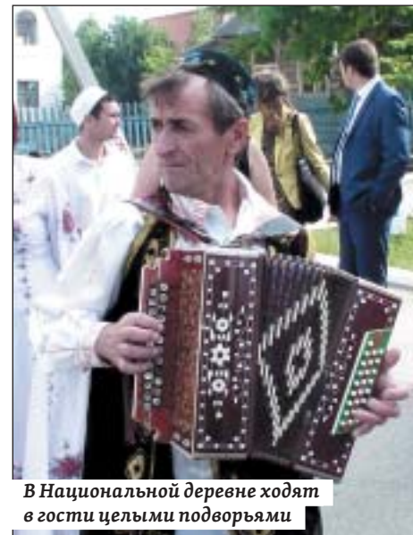
В Национальной деревне ходят в гости целыми подворьями

том лучших практик других субъектов ПФО, уже имеющих такие документы.