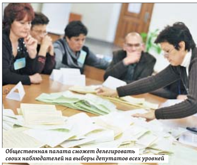
Общественная палата сможет делегировать своих наблюдателей на выборы депутатов всех уровней

Большинством голосов члены комитета проголосовали за внесение изменений в региональный закон «Об Общественной палате Саратовской области» в повестку дня заседания облдумы в первом и втором чтении.