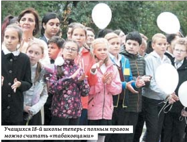
Учащиеся 18-й школы теперь с полным правом можно считать «табаковцами»

В открытии мемориальной доски на 18-й школе принимали участие официальные лица –