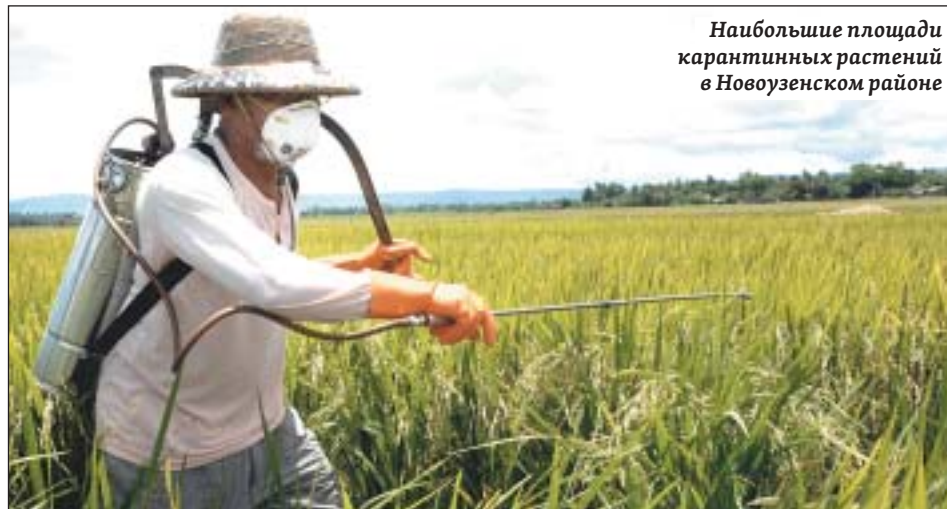
Наибольшие площади карантинных растений в Новоузенском районе

никаких практических мероприятий по борьбе с сорняками не проводилось, – заключил замминистра.