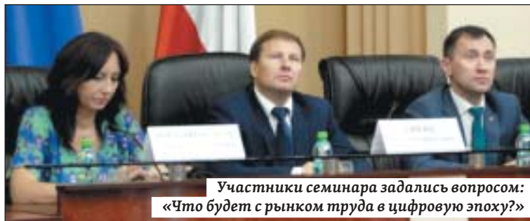
Участники семинара задались вопросом: «Что будет с рынком труда в цифровую эпоху?»

зобрать перспективы перевода экономики на «цифру».