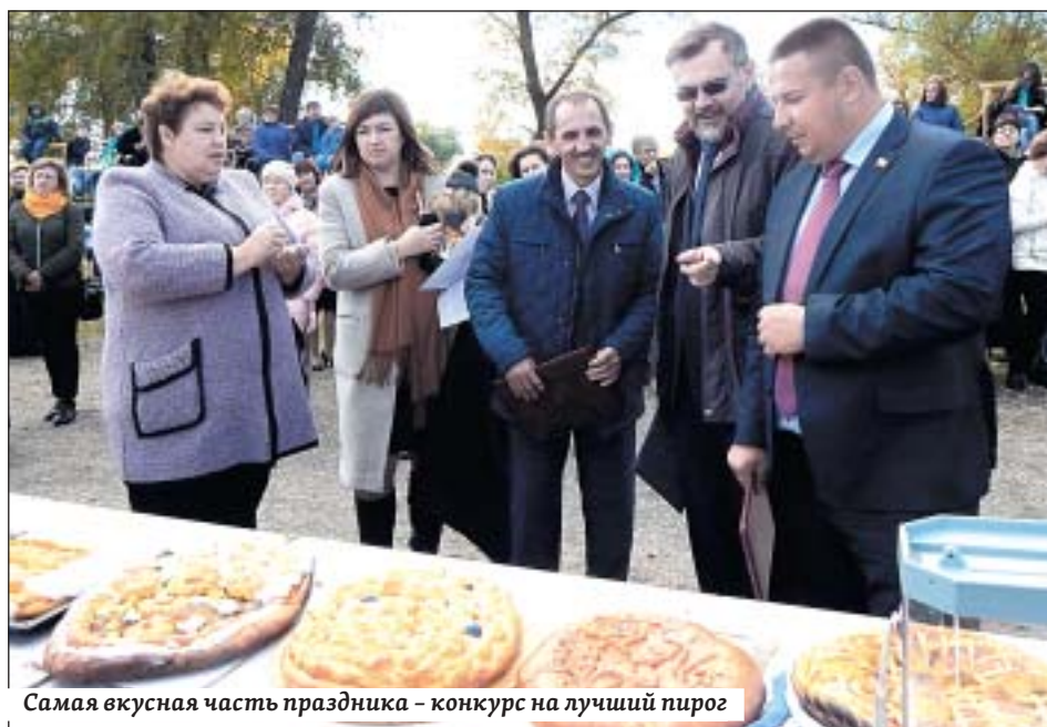
Самая вкусная часть праздника – конкурс на лучший пирог