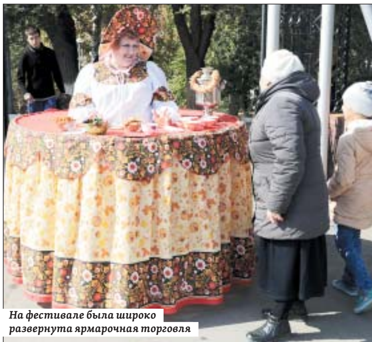
На фестивале была широко развернута ярмарочная торговля

– Нужны совместные предприятия – раз, второе – глубокая переработка туш. Я готов с кем-то создать совместное