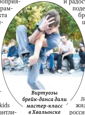
Виртуозы брейк-данса дали мастер-класс в Хвалынске

Фестиваль «Open kids battle» объединил талантли-