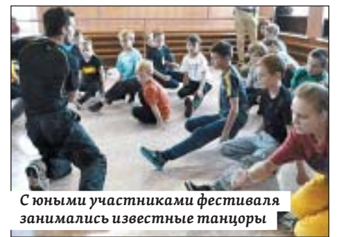
С юными участниками фестиваля занимались известные танцоры