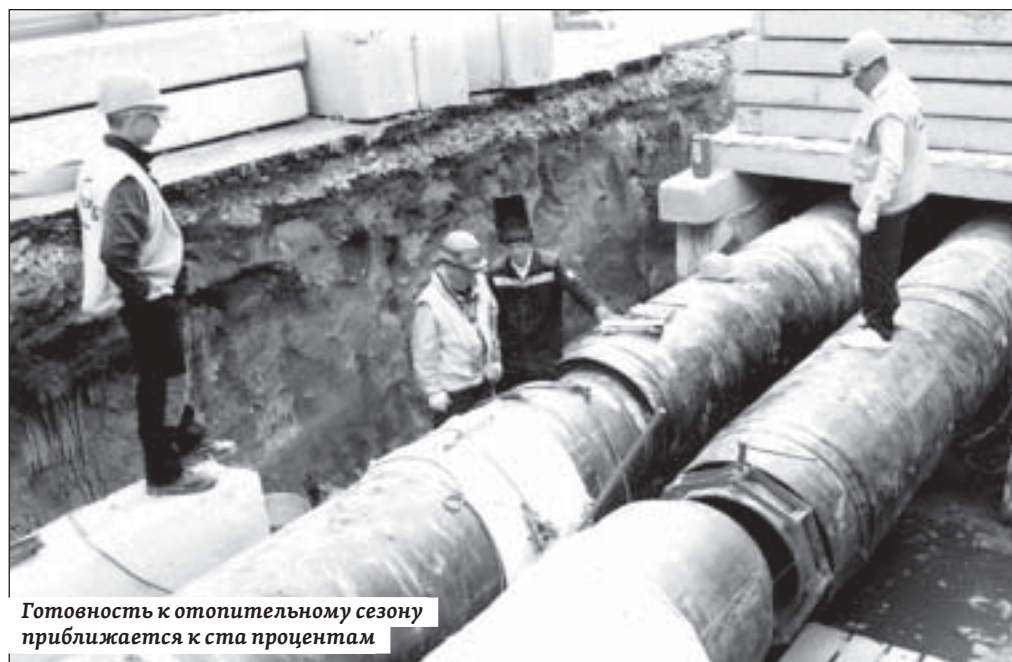
Готовность к отопительному сезону приближается к ста процентам

Филиалом «Саратовский» ПАО «Т Плюс» капитально отремонтировано четыре котла, 25,5 км магистральных трубопроводов.