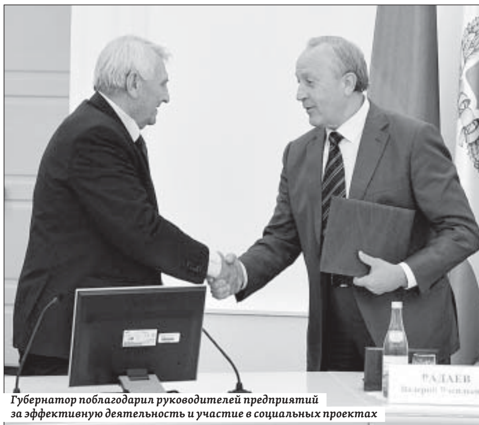
Губернатор поблагодарил руководителей предприятий за эффективную деятельность и участие в социальных проектах

Губернатор напомнил слова президента страны о необходимости поступательного роста производительности труда, прорывного развития экономики, что должно отразиться на благосостоянии граждан.