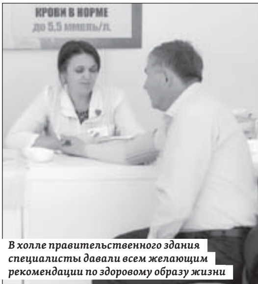
В холле правительственного здания специалисты давали всем желающим рекомендации по здоровому образу жизни