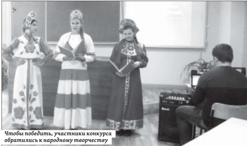
Чтобы победить, участники конкурса обратились к народному творчеству