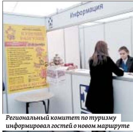
Региональный комитет по туризму информировал гостей о новом маршруте

В Саратове участникам ярмарки «Купечий разгуляй» презентовали новый туристический маршрут в балаковское село Малое Перекопное.