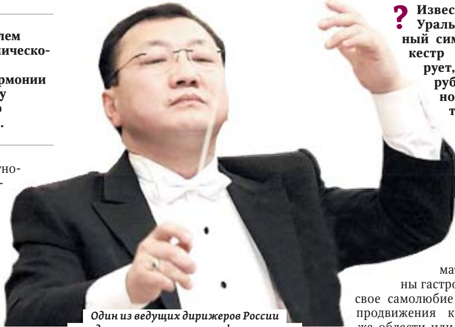
Один из ведущих дирижеров России придаст саратовскому симфоническому оркестру новые оттенки звучания