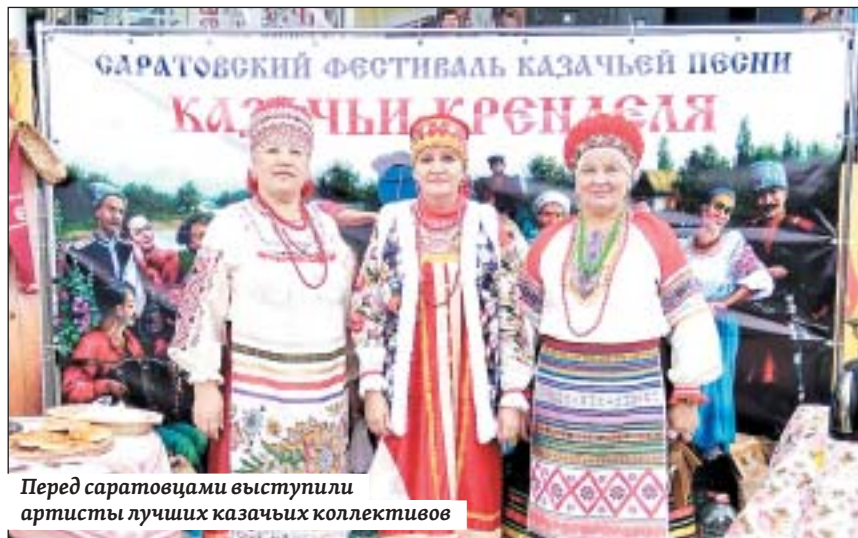
Перед саратовцами выступили артисты лучших казахских коллективов

Стоит добавить, что примерно у трети участников в процессе осмотра впервые выявлена сердечно-сосудистая патология. Данные заносились в специальный журнал, после они будут переданы участковым врачам в поликлиники по месту жительства.