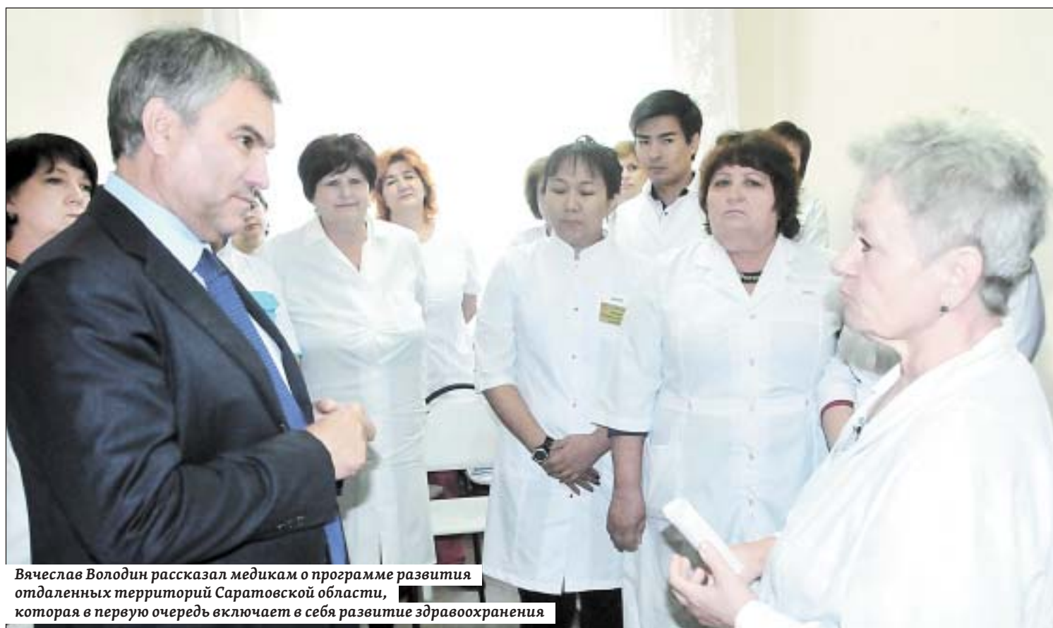
Вячеслав Володин рассказал медикам о программе развития отдаленных территорий Саратовской области, которая в первую очередь включает в себя развитие здравоохранения

Олег ТРИГОРИН, фото пресс-службы губернатора