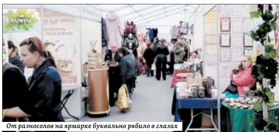
От разносолов на ярмарке буквально рябило в глазах

В трехдневной программе были викторины, розыгрыши призов, а также фестиваль «Казачьи кренделя».