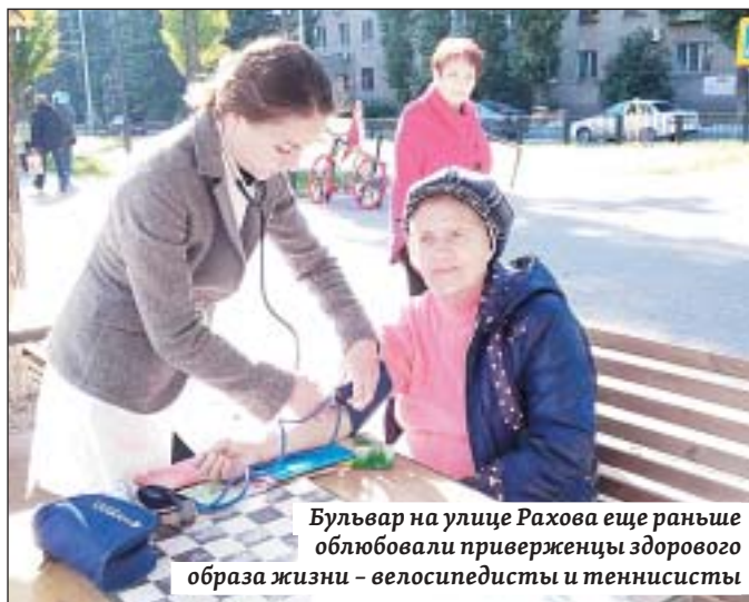
Бульвар на улице Рахова еще раньше облюбовали приверженцы здорового образа жизни – велосипедисты и теннисисты

– Например, ходьба является универсальным