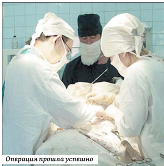
Операция прошла успешно