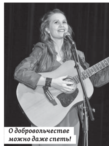
О добровольчестве можно даже спеть!

программы – «Покажи себя». Зрителей захватил калейдоскоп выступлений: спорт, кулинария, вокал, игра на гитаре, алмазная вышивка, хореография – каждое было уникальным. А объединяющую роль сыграл танцевальный флеш-