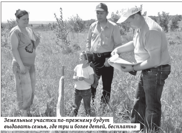
Земельные участки по-прежнему будут выдавать семьям, где три и более детей, бесплатно

По мнению энгельских депутатов, законопроект прежде всего направлен на упрощение процедуры предоставления земельных участков многодетным семьям, где бы они ни проживали – в