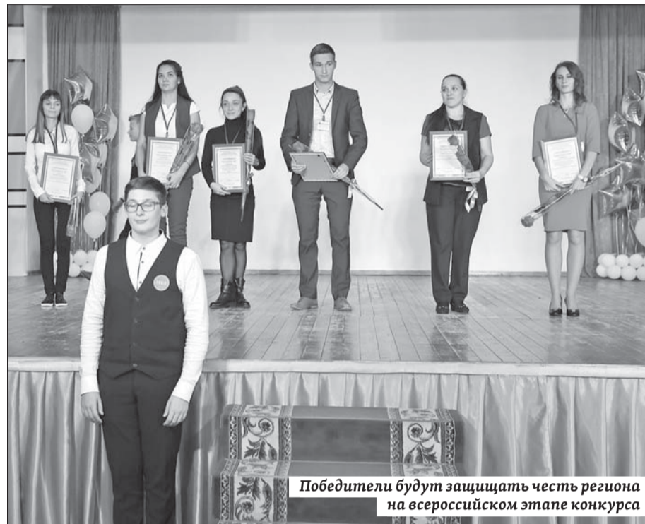
Победители будут защищать честь региона на всероссийском этапе конкурса

В регионе конкурс проходит уже десять лет, и год от года только набирает обороты. Растет количество участников и число номинаций. Так, в 2017 году появилась номинация «Педа-