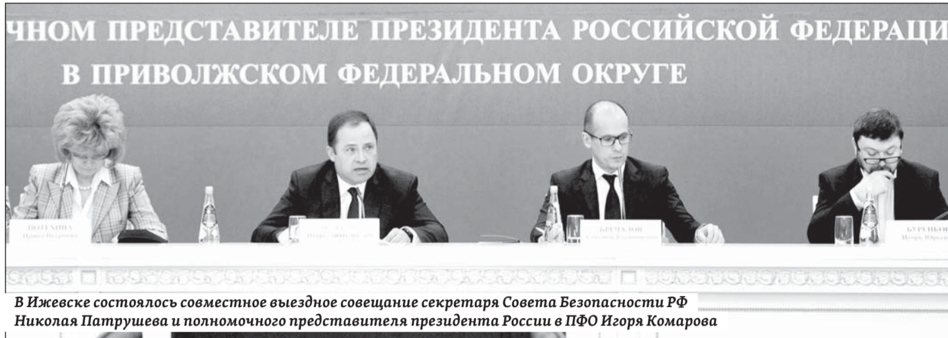
В Ижевске состоялось совместное выездное совещание секретаря Совета Безопасности РФ Николая Патрушева и полномочного представителя президента России в ПФО Игоря Комарова