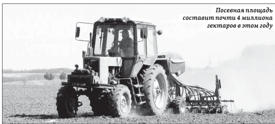
Посевная площадь составит почти 4 миллиона гектаров в этом году

планируется произвести не менее 4,2 миллиона тонн зерновых и зернобобовых культур, 1,2 миллиона тонн подсолнечника.