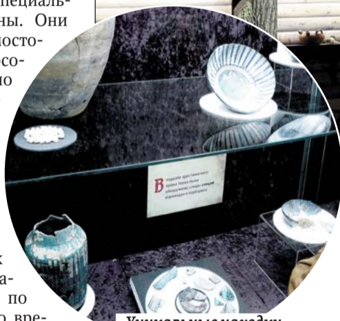
Уникальные находки поражают совершенством форм и красок

к средневековью подпитывает и новая выставка. Кроме уникальных артефактов из раскопок, на ней представлена живопись современных художников, изображающих картины быта и пейзажи Увекки. При этом фантазии мастеров кисти основаны на точных исторических данных.