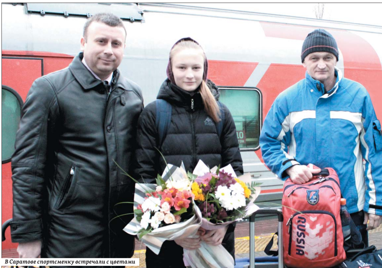
В Саратове спортсменку встречали с цветами