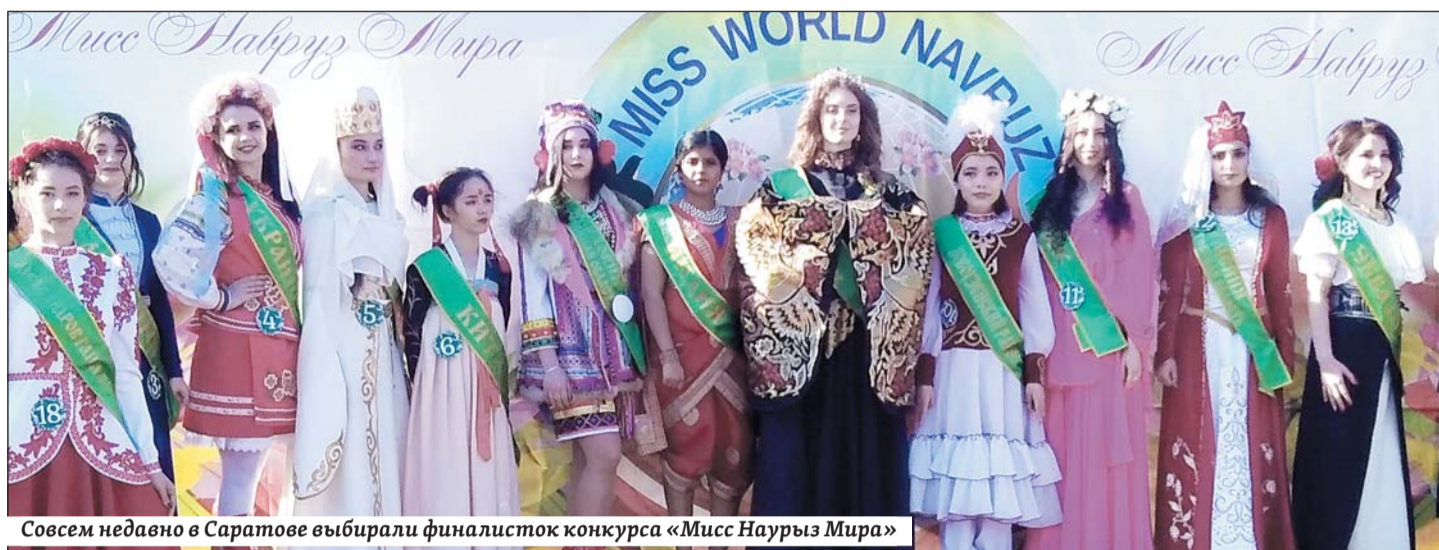
Совсем недавно в Саратове выбрали финалисток конкурса «Мисс Наурыз Мира»

Студенты привели примеры такого взаимного проникновения: совсем недавно все дружно праздновали русскую масленицу, а сейчас отмечают Наурыз – праздник плуга. Объединяет их то, что оба возникли у славянских и азиатских народов еще до появления христианства и ислама, то есть это два древнейших национальных праздника, которые