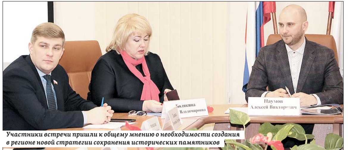
Участники встречи пришли к общему мнению о необходимости создания в регионе новой стратегии сохранения исторических памятников

Вокруг проекта возрождения Татарской слободы, разработанного казанскими архитекторами, объединились все: общественность, горожане, власть. Кстати, правительственные чиновники персонально от-