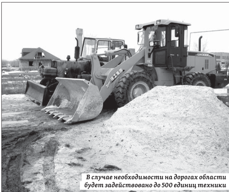
В случае необходимости на дорогах области будет задействовано до 500 единиц техники

О подготовке к пропуску талых вод рассказал представитель ГКУ «Дирекция транспорта и дорожного хозяйства» Владимир Коцюба. От снега очищено более 5,7 тысячи километров обочин дорог, почти 200 тысяч погонных метров дорожного ограждения и четыре тысячи водопропускных труб.