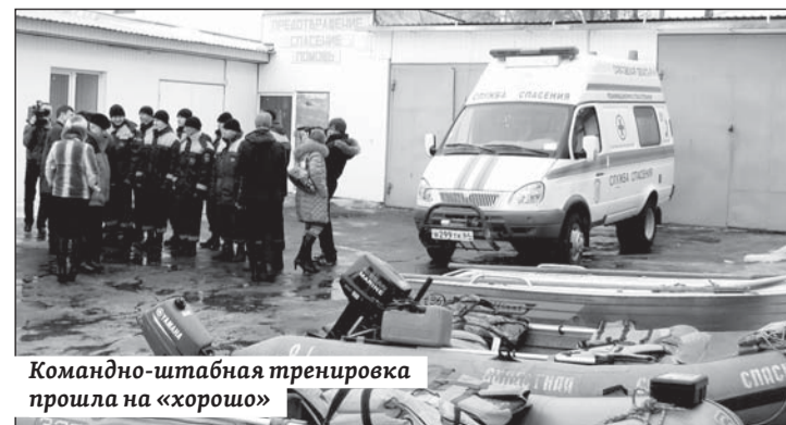
Командно-штабная тренировка прошла на «хорошо»

На финансирование противопаводковых мероприятий бюджетом района запланировано 300 тысяч рублей. Указанные средства будут направлены на укрепление дамбы в районе балашовского предприятия «Хлебоприемный пункт № 7», ремонт шиберной заслонки и установку насосной станции по перекачке талой воды в микрорайоне «Низы», очистку ливневых канализаций и восстановление уличного освещения в зонах возможного подтопления. Также заготовлен необходимый запас горюче-смазочных материалов, 3000 мешков с песком и резерв песка в количестве 36 тонн на базе МУП «Благоустройство и озеленение». Станции водоподготовки системы городского водоснабжения обеспечены необходимыми реагентами и материалами в полном объеме. По предварительному прогнозу Саратовского центра по гидрометеорологии и мониторингу окружающей среды максимальный уровень весеннего половодья на реке Хопер на территории Балашовского района составит 810–850 сантиметров (опасная отметка – 920 см). На 26 марта уровень Хопра был зафиксирован на отметке 530 см.