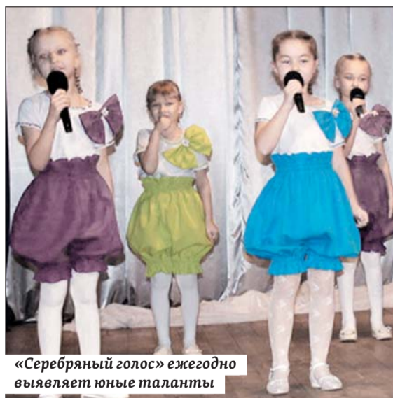
«Серебряный голос» ежегодно выявляет юные таланты