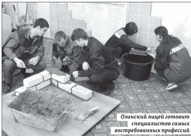
Озинский лицей готовит специалистов самых востребованных профессий