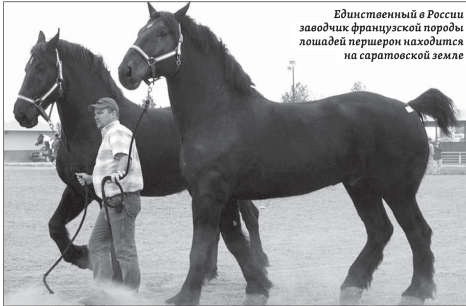
Единственный в России заводчик французской породы лошадей першерон находится на саратовской земле