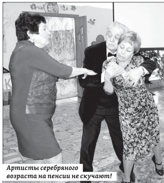
Артисты серебряного возраста на пенсии не скучают!

Все последующие месяцы пенсионеры с удовольствием примеряют разные роли, а осо-