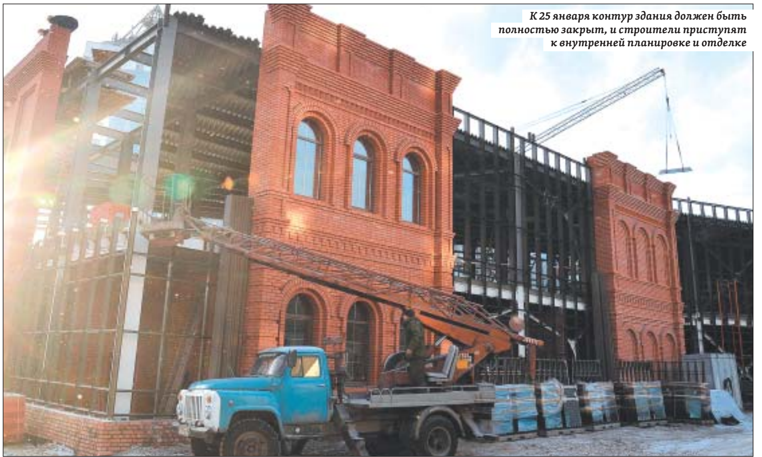
К 25 января контур здания должен быть полностью закрыт, и строители приступят к внутренней планировке и отделке