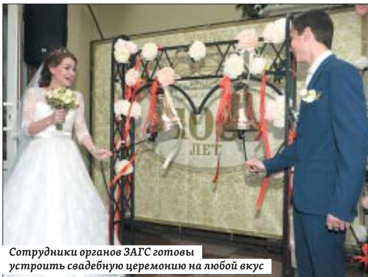
Сотрудники органов ЗАГС готовы устроить свадебную церемонию на любой вкус

Специалисты центра – психологи, медиаторы, юристы – объединились, чтобы в трудный для семьи час оказать бесплатную и квалифицированную помощь и мирно разрешить конфликт, сохранить