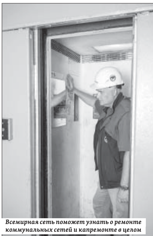
Всемирная сеть поможет узнать о ремонте коммунальных сетей и капремонте в целом

Также краткосрочный план областной программы капремонта и нормативный акт, которым этот план утвержден, можно будет найти на портале регионального министерства строительства и ЖКХ.