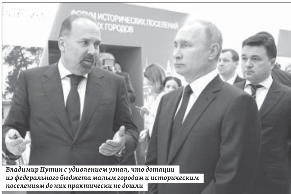
Владимир Путин с удивлением узнал, что дотации из федерального бюджета малым городам и историческим поселениям до них практически не дошли