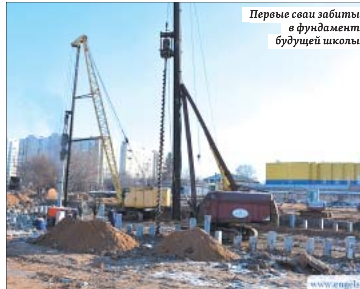
Первые сваи забиты в фундамент будущей школы

но наблюдают, что нового происходит на стройке. Вот сейчас, например, началась разборка старого ветхого школьного здания. Одновременно идет закладка фундамента будущего комплекса.