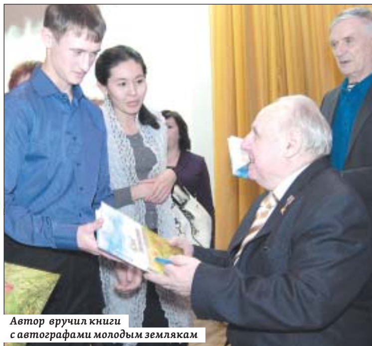
Автор вручил книги с автографами молодым землякам

Несколько экземпляров новой книги Лепехин подарил сельским библиотекам, вы-