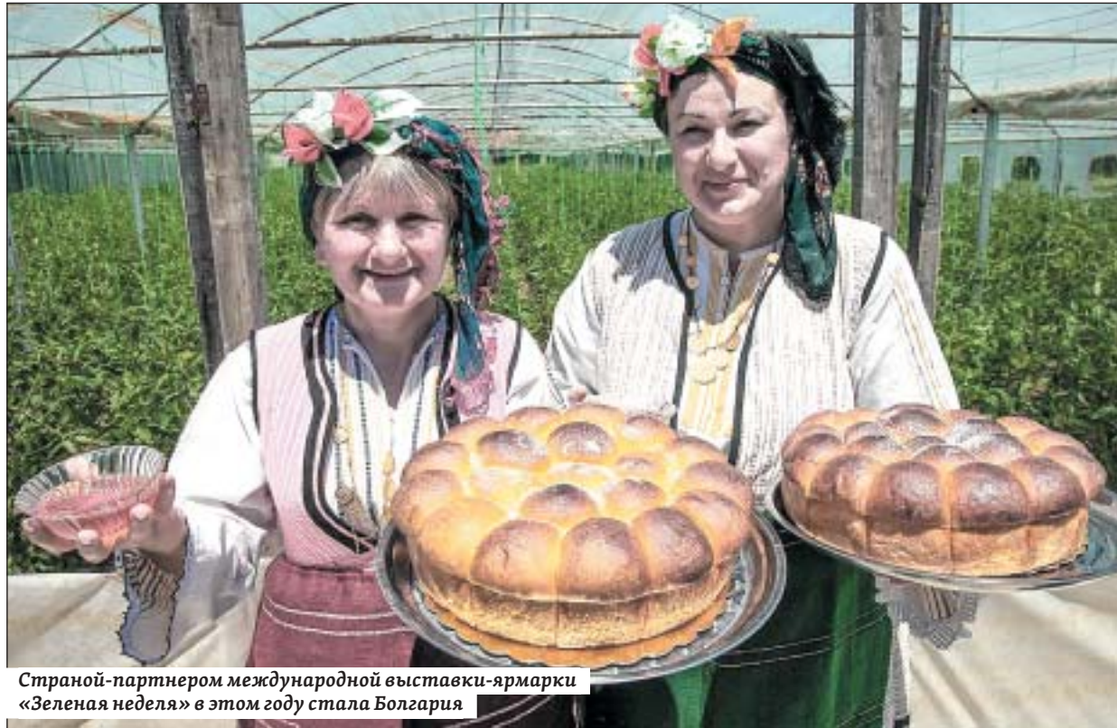
Страной-партнером международной выставки-ярмарки «Зеленая неделя» в этом году стала Болгария

На территории выставочного комплекса «Мессе Берлин» саратовцы примут участие в мероприятиях федерального уровня: в торжественном открытии российского стенда и в панельной дискуссии по перспективам развития сотрудничества Германии и России в