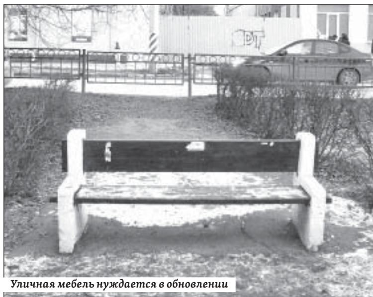
Уличная мебель нуждается в обновлении

перспективной замены старых насаждений. Процесс замены должен вестись постепенно, старые вязы и другие деревья должны подвергаться только щадящей омолаживающей обрезке под контролем специалистов наших вузов.