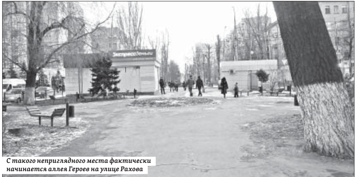
С такого неприглядного места фактически начинается аллея Героев на улице Рахова

При этом нужно максимально сохранить деревья и кустарники, высадить новые для