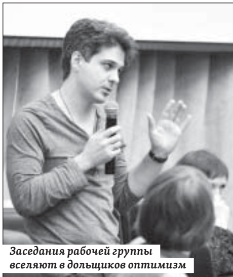
Заседания рабочей группы вселяют в дольщиков оптимизм

Вместе с тем, остается большая группа объектов, где в обязательном порядке необходимо дождаться завершения судебной процедуры банкротства прежнего заказчика строительства. В их числе