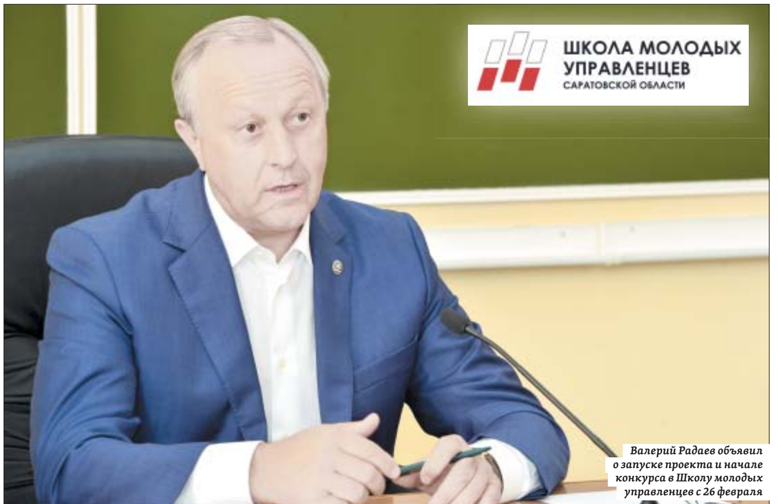
Валерий Радаев объявил о запуске проекта и начале конкурса в Школу молодых управленцев с 26 февраля