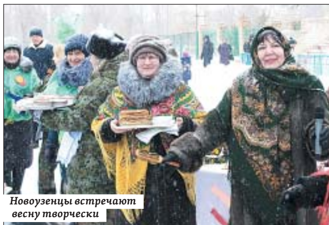
Новоузенцы встречают весну творчески

– Работники учреждений культуры района, проявив смекалку и креативный подход, изготовили прекрасных кукол, которые были представ-