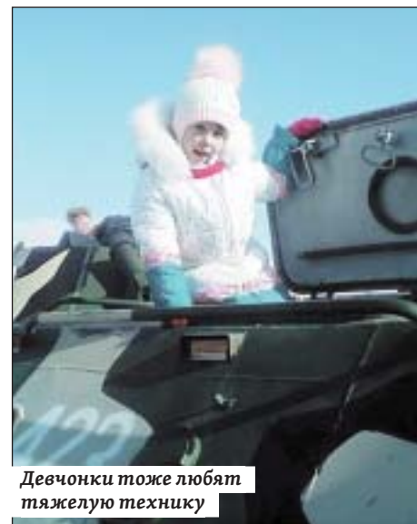
Девчонки тоже любят тяжелую технику