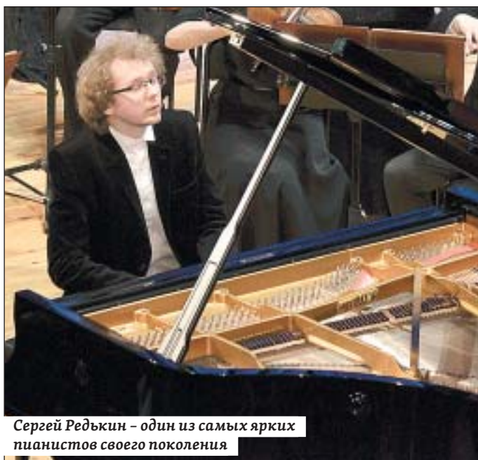
Сергей Редькин – один из самых ярких пианистов своего поколения