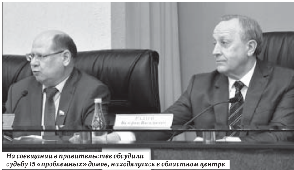
На совещании в правительстве обсудили судьбу 15 «проблемных» домов, находящихся в областном центре

– Там 30 квартир были куплены дольщиками. Остальные площади за юридическими лицами, которые «лапы сложили» и ждут. А ждут они, когда областные власти достроят дом и юридические лица смогут завершить свой бизнес-проект, – констатировал сенатор.