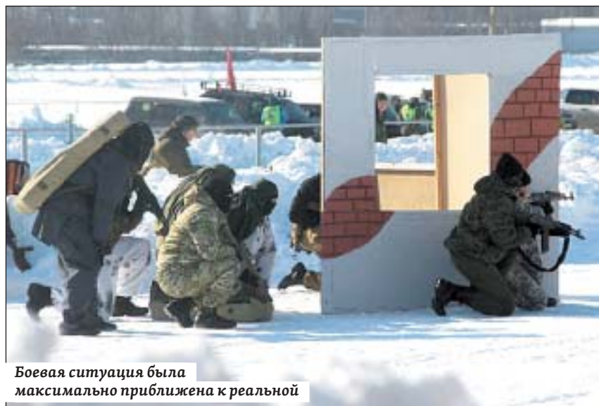
Боевая ситуация была максимально приближена к реальной