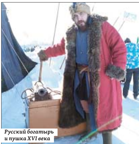
Русский богатырь и пушка XVI века