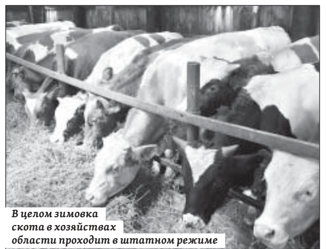
В целом зимовка скота в хозяйствах области проходит в штатном режиме

С начала зимовки в сельхозпредприятиях и КФХ родилось 8,1 тысячи телят. До конца зимовки ожидается прибавление еще 27 тысяч голов.