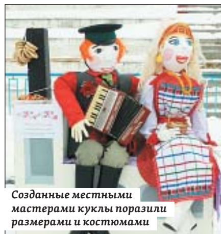
Созданные местными мастерами куклы поразили размерами и костюмами

Масленикина», созданная коллективом Центральной библиотеки, и кукла «Доньшко – красно солнышко» Детской школы искусств, – рассказала заведующая городским организационно-методическим центром МУК «Культурно-до-