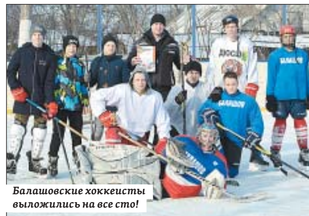
Балашовские хоккеисты выложились на все сто!

Саратовская областная газета «Регион 64»