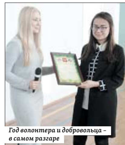
Год волонтера и добровольца — в самом разгаре