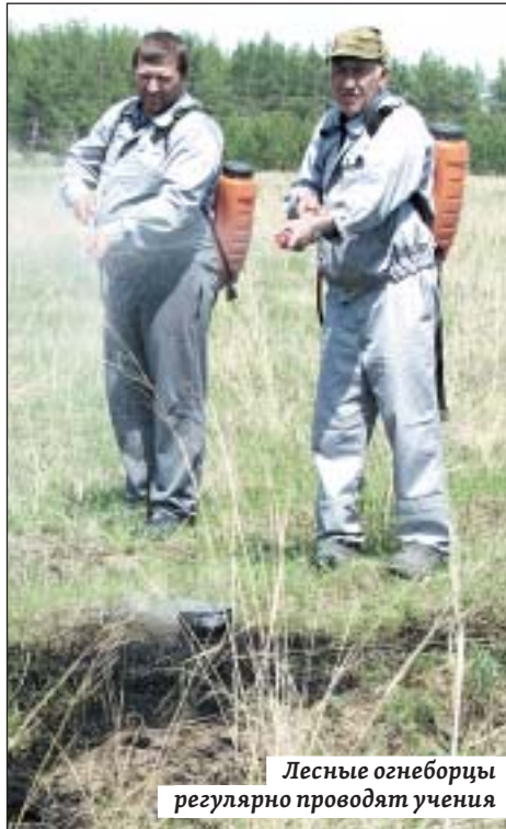
Лесные огнеборцы регулярно проводят учения

зафиксированы в Базарно-Карабулакском, Аткарском, Черкасском (Вольский район), Саратовском, Красноармейском лесничествах. В связи с этим в Аркадакском, Базарно-Карабулакском, Петровском, Саратовском и Ртищевском районах введен особый противопожарный режим.