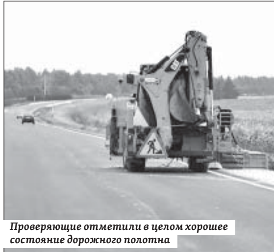
Проверяющие отметили в целом хорошее состояние дорожного полотна