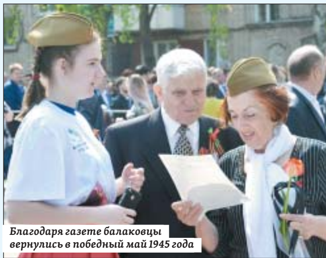
Благодаря газете балаковцы вернулись в победный май 1945 года

В рамках празднования 73-й годовщины окончания Великой Отечественной войны активисты движения «Волонтеры Победы» дарят газету землякам. Представители старшего поколения очень благодарны за внимание, а некоторые даже обещали повесить по-