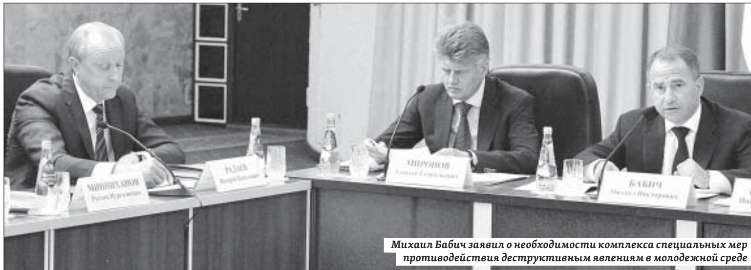
Михаил Бабич заявил о необходимости комплекса специальных мер противодействия деструктивным явлениям в молодежной среде

По словам полпреда, деструктивному влиянию и негативным проявлениям чаще всего подвержена именно молодежь. Вместе с тем, подрастающее поколение – основной ресурс национальной безопасности страны и безусловный гарант поступательного развития общества, экономиче-