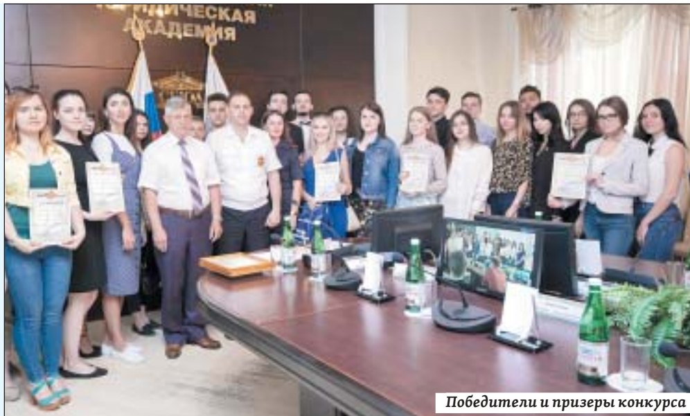
Победители и призеры конкурса