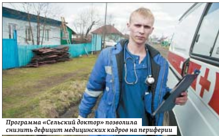
Программа «Сельский доктор» позволила снизить дефицит медицинских кадров на периферии