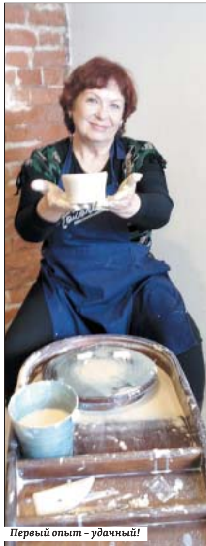
Первый опыт – удачный!

– Вообще керамика – моя слабость. Дома целая коллекция керамических изделий, которая теперь, надеюсь, пополнится и моими собственными