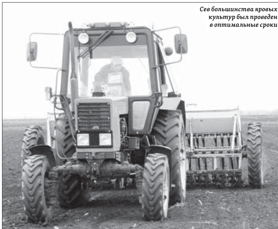
Сев большинства яровых культур был проведен в оптимальные сроки

Вместе с тем Зайцев отметил, что после обильных и продолжительных дождей весной запасы продуктивной влаги на полях с озимыми культурами в Ершовском, Федоровском, Балаковском, Краснокутском, Ка-