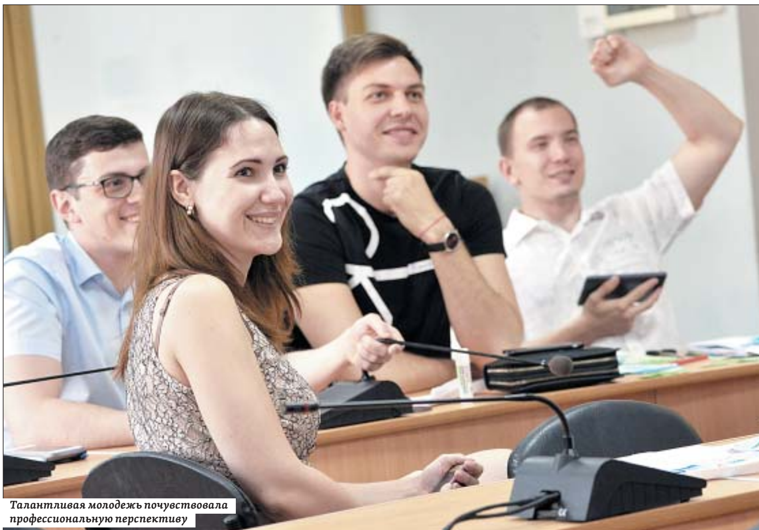
Талантливая молодежь почувствовала профессиональную перспективу

Владимир АКИШИН, фото пресс-службы губернатора