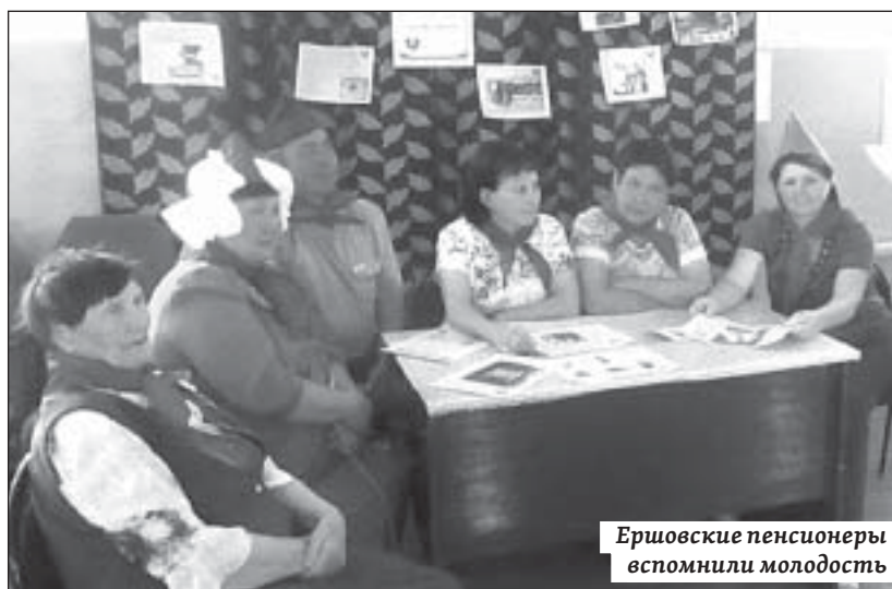
Ершовские пенсионеры вспомнили молодость