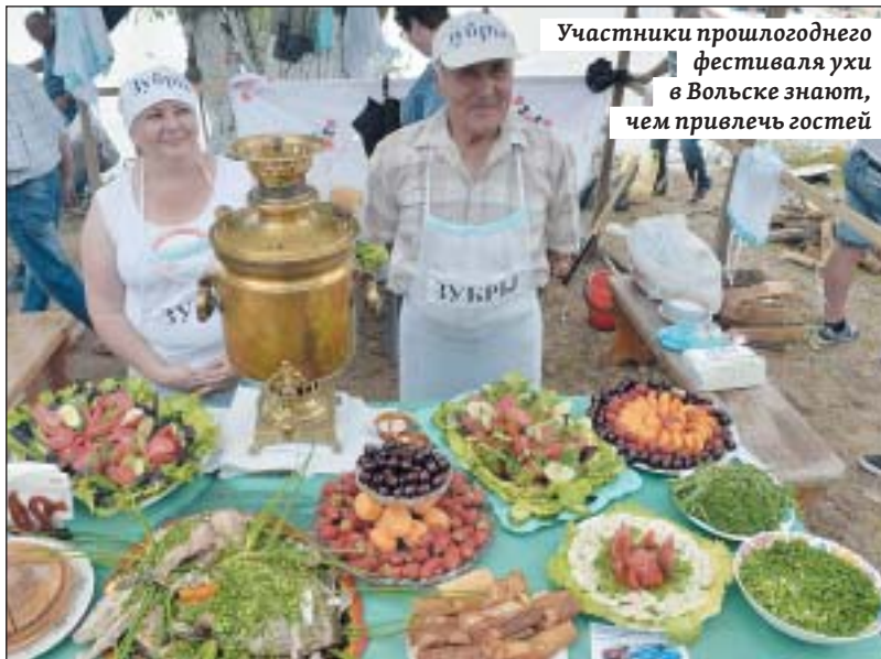
Участники прошлогоднего фестиваля ухи в Вольске знают, чем привлечь гостей

был организован в 2012 году, создано семь объектов туристской инфраструктуры, среди которых: гостинично-развлекательный комплекс, развлекательный комплекс, туристский комплекс, яхт-клуб, конгресс-отель и экопарк. На этих объектах создано 450 новых рабочих мест, а налоговые отчисления измеряются сотнями миллионов рублей.