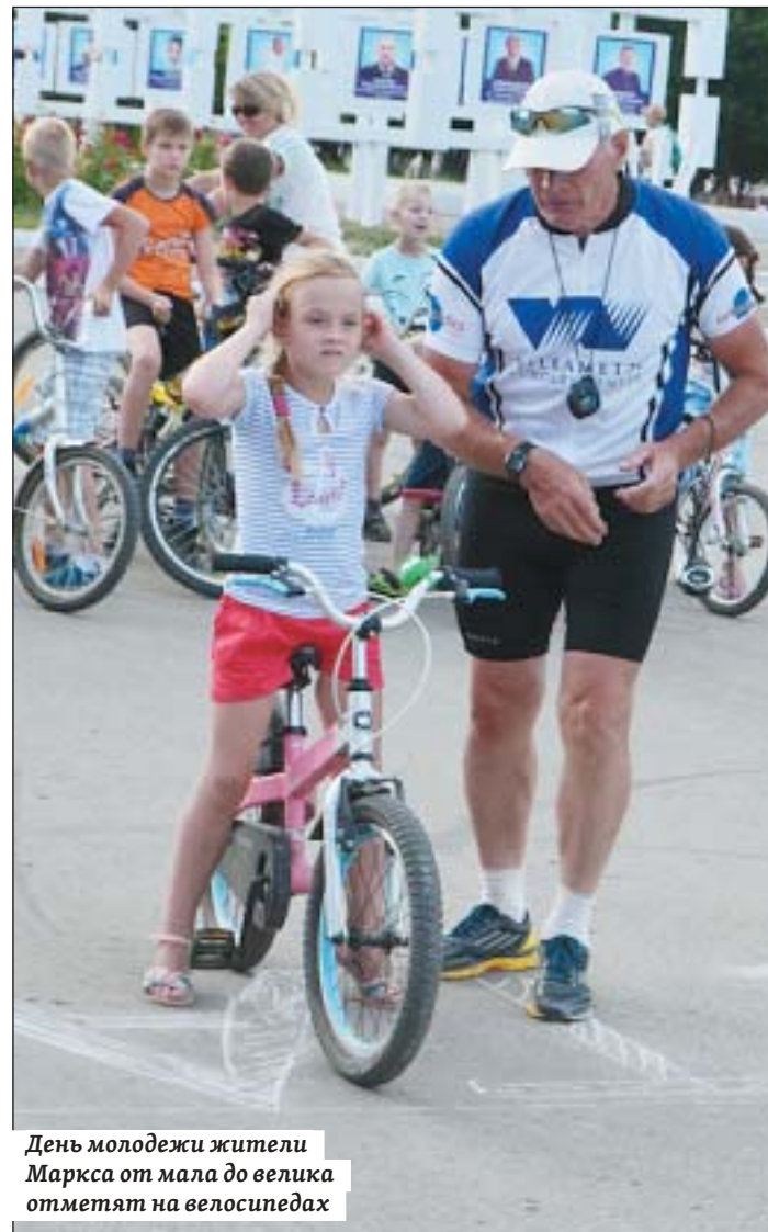
День молодежи жители Маркса от мала до велика отмечают на велосипедах