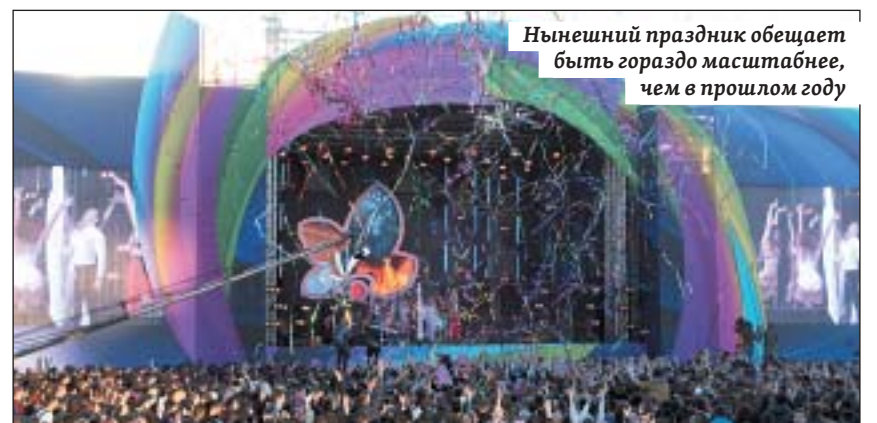
Нынешний праздник обещает быть гораздо масштабнее, чем в прошлом году

В финале зрителей ждут сюрпризы, организаторы обещают: будет очень ярко! Финальным штрихом «Розы ветров» станет красочный фейерверк, который запустят в небе над площадью.