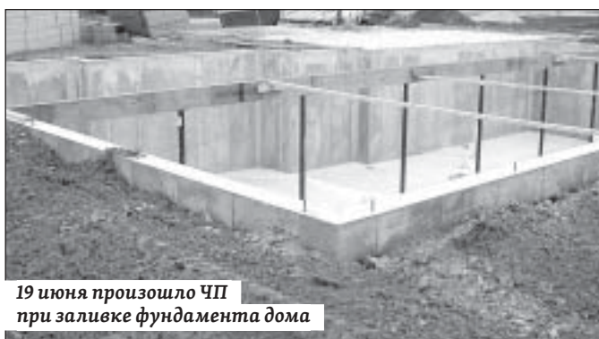
19 июня произошло ЧП при заливке фундамента дома

Вечером 19 июня в селе Мергичевка Саратовского района строители при помощи бетонного миксера заливали фундамент здания на территории частного домовладения. Во время работы стрела бетононасоса при подъеме коснулась высоковольтной линии электропередачи, в результате чего спецтехника загорелась. Получившему ожоги 48-лет-