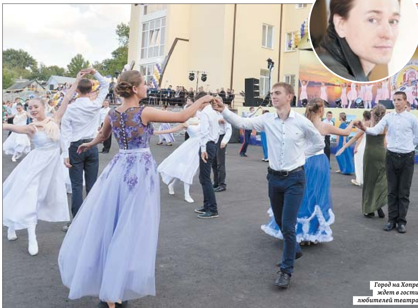
Город на Хопре ждет в гости любителей театра