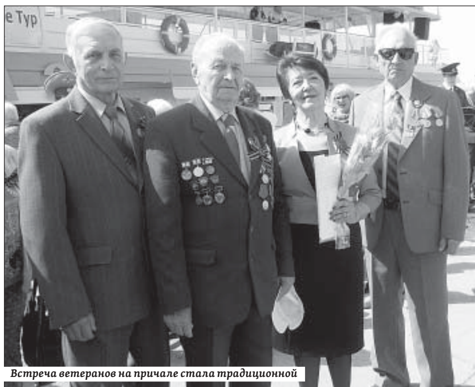
Встреча ветеранов на причале стала традиционной