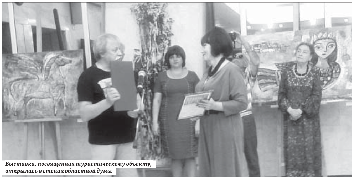
Выставка, посвященная туристическому объекту, открылась в стенах областной думы