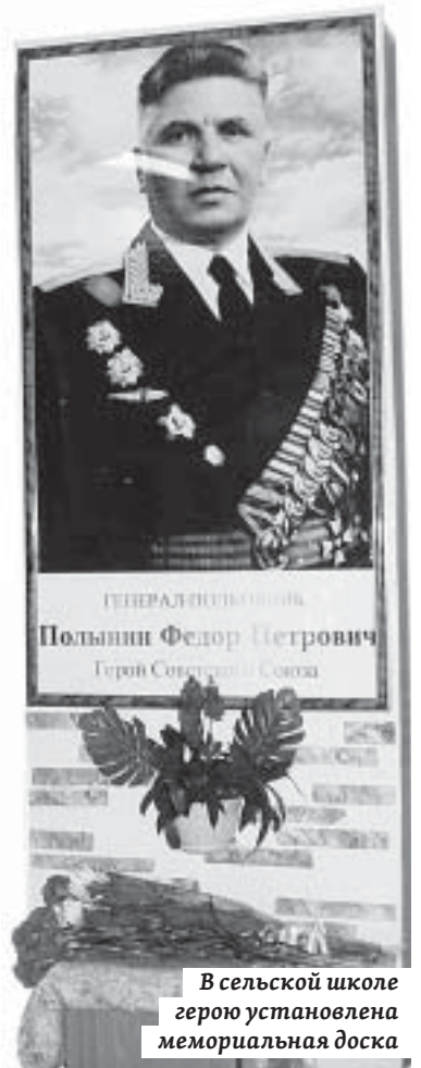
В сельской школе герою установлена мемориальная доска