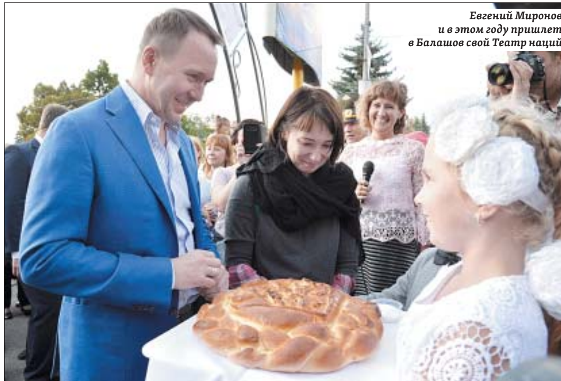
Евгений Миронов и в этом году прилетит в Балашов свой Театр наций