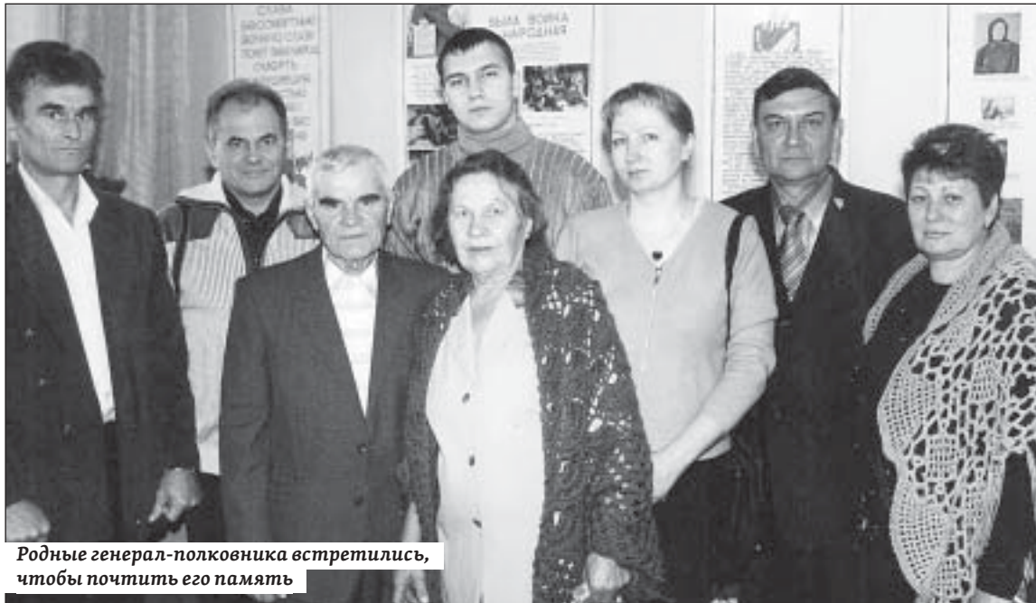
Родные генерал-полковника встретились, чтобы почтить его память