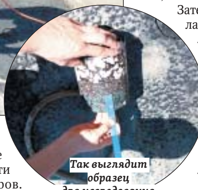
Так выглядит образец для исследования

этапе ведения работ позволяет максимально быстро выявлять и устранять недоработки, – отметил министр Николай Чуриков.