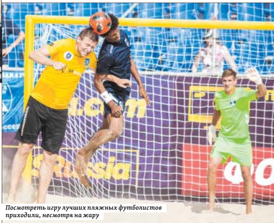
Посмотреть игру лучших пляжных футболистов приходили, несмотря на жару

ную и неуступчивую команду из Самары «Крылья Советов». Успешным оказалось и второе выступление: