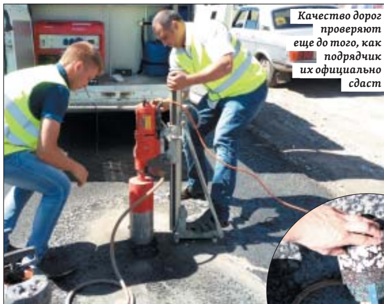
Качество дорог проверяют еще до того, как подрядчик их официально сдаст