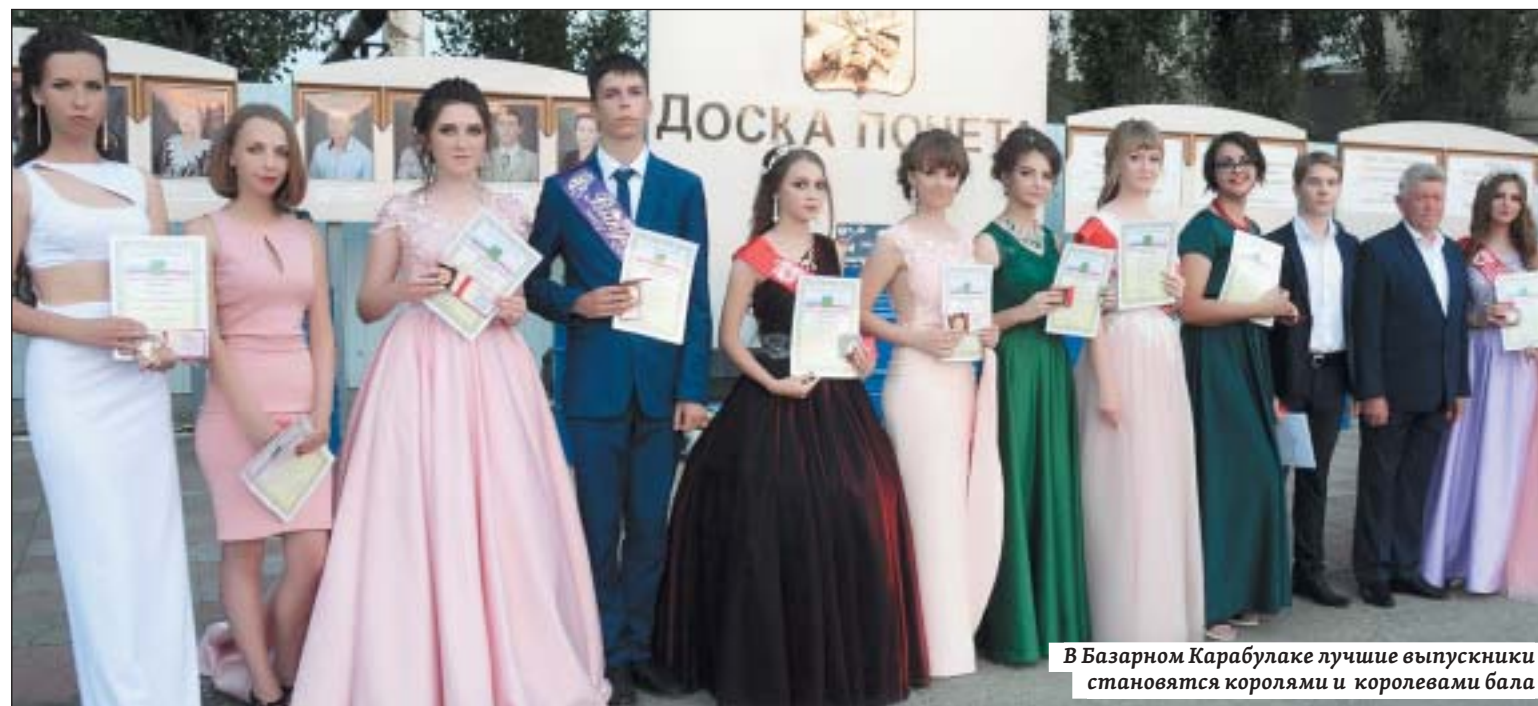
В Базарном Карабулаке лучшие выпускники становятся королями и королевами бала