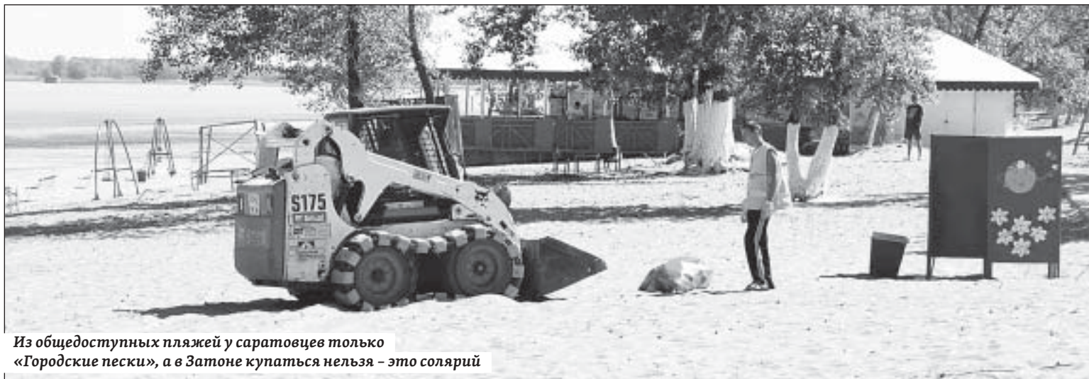
Из общедоступных пляжей у саратовцев только «Городские пески», а в Затоне купаться нельзя – это солярий

– Такое начало купального сезона крайне тревожит. А если честно – повергает в шок. Из года в год мы говорим о необходимости профилактики несчастных случаев на воде, о работе с неблагополучными семьями, где есть маленькие дети, о запретительных мерах по купанию в неустановленных местах, а на выходе полу-