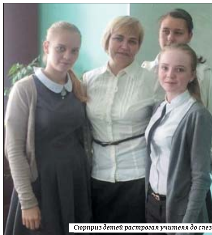
Сюрприз детей растрогал учителя до слез