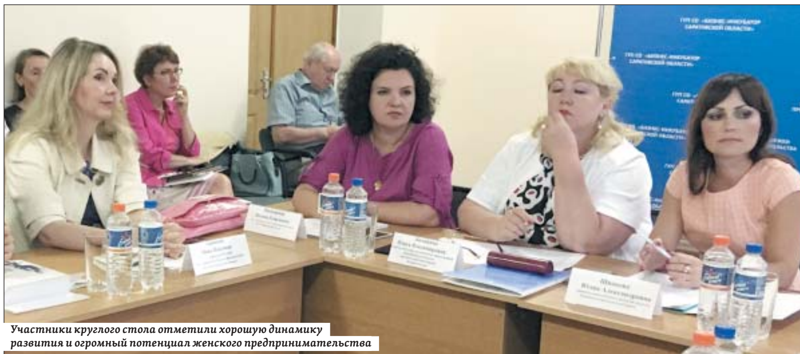
Участники круглого стола отметили хорошую динамику развития и огромный потенциал женского предпринимательства

Безусловно, эти слова главы региона в полной мере относятся и к женщинам-предпринимателям, которые еще покажут во всю мощь, на что они способны, и прославят Саратовскую область.