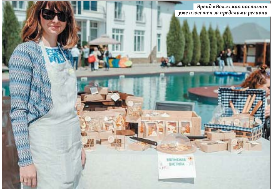
Бренд «Волжская пастила» уже известен за пределами региона

– Женщины, как правило, более хозяйственные, целеустремленные, экономные, аккуратные, коммуникабельные, ответственные в своих решениях, готовые к получению новых знаний и навыков и так далее. Именно такие женщины и вступают в нашу общественную организацию, чтобы соз-