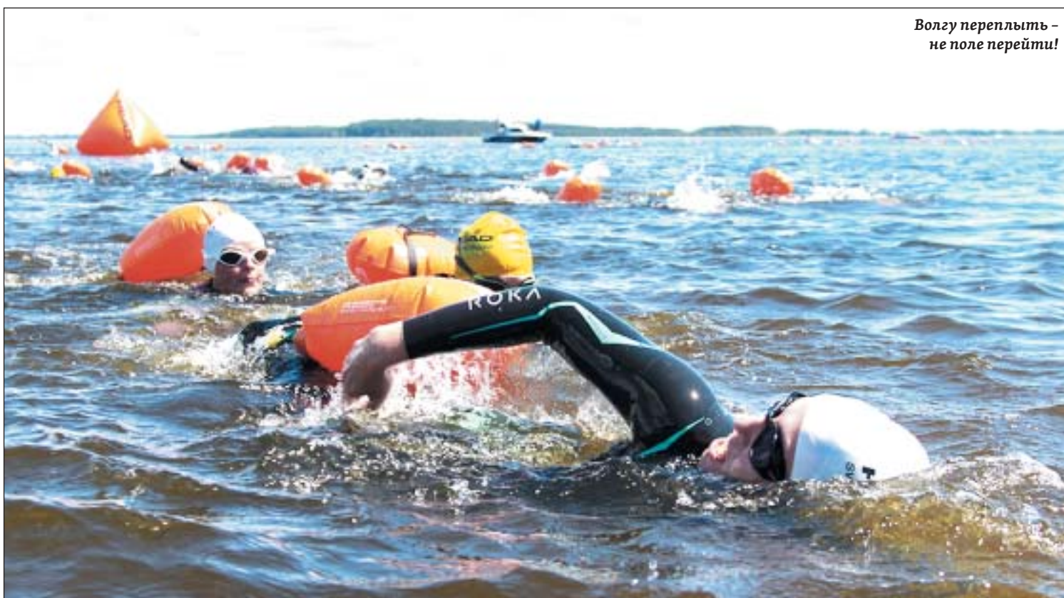
Волгу переплыть – не поле перейти!