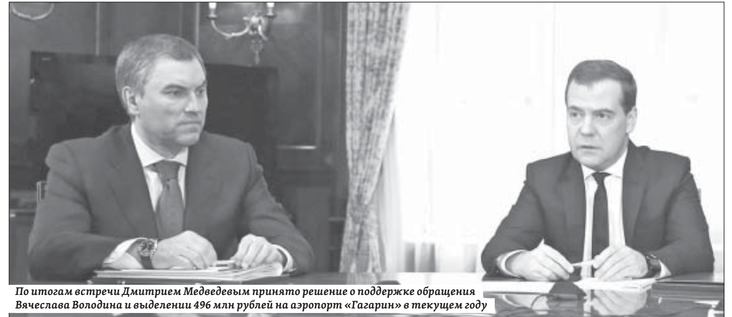
По итогам встречи Дмитрием Медведевым принято решение о поддержке обращения Вячеслава Володина и выделении 496 млн рублей на аэропорт «Гагарин» в текущем году