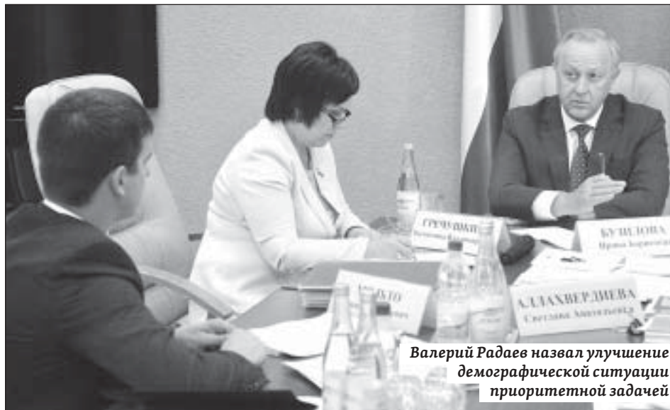
Валерий Радаев назвал улучшение демографической ситуации приоритетной задачей

Работа социального блока наиболее чувствительна для населения, вызывает широкий общественный отклик. Демография, здоровье, продолжительность жизни – ключевые сферы деятельности системы здравоохранения и социальной сферы, а также базовые разделы национальной стратегии развития страны. У министерств социального блока самый мощный охват населения и самая крупная сеть подведомственных учреждений, – отметил глава региона.