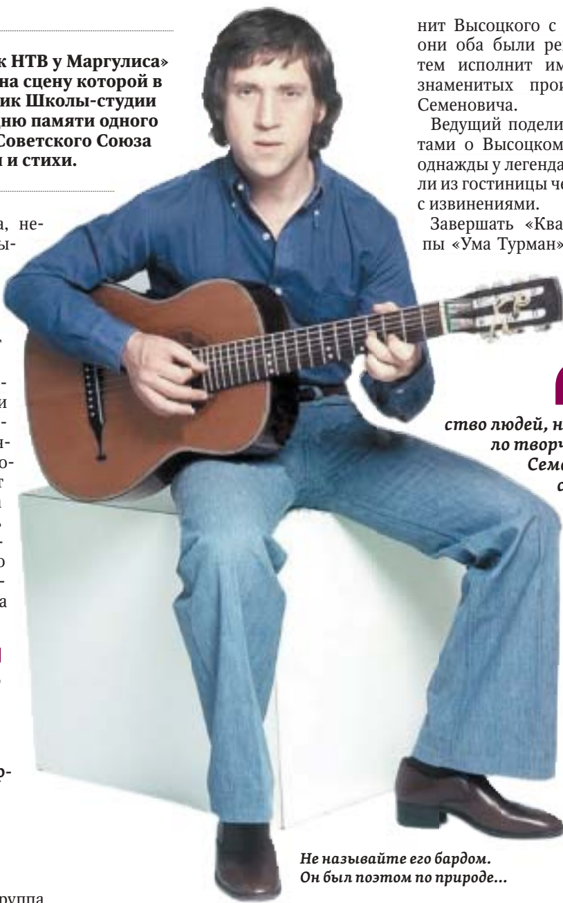
Не называйте его бардом. Он был поэтом по природе...