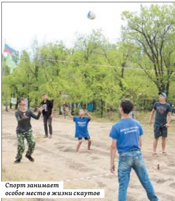
Спорт занимает особое место в жизни скаутов