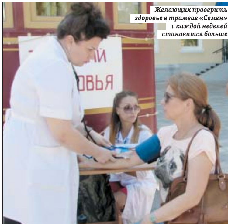
Желающих проверить здоровье в трамвае «Семен» с каждой неделей становится больше

Такие мини-справочники будут полезны в каждом доме: в критической ситуации, как правило, нет времени на раз-