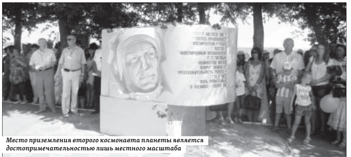
Место приземления второго космонавта планеты является достопримечательностью лишь местного масштаба

Мемориальная композиция состоит из 10-метрового обелиска и горельефа с изображением Германа Степановича Титова. Оба объекта находятся в хорошем состоянии.