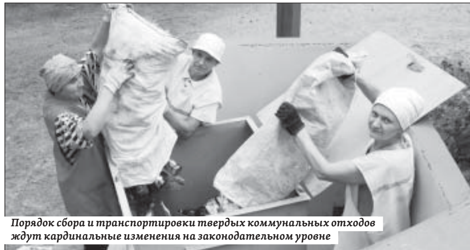
Порядок сбора и транспортировки твердых коммунальных отходов ждут кардинальные изменения на законодательном уровне

Под напором парламентариев представитель министерства природных ресурсов и экологии региона пообещал провести в августе депутатские слуша-