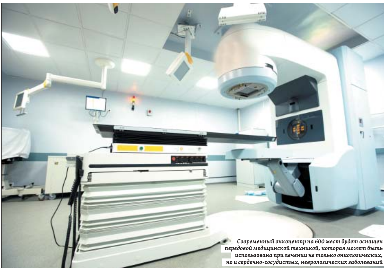
Современный онкоцентр на 600 мест будет оснащен передовой медицинской техникой, которая может быть использована при лечении не только онкологических, но и сердечно-сосудистых, неврологических заболеваний