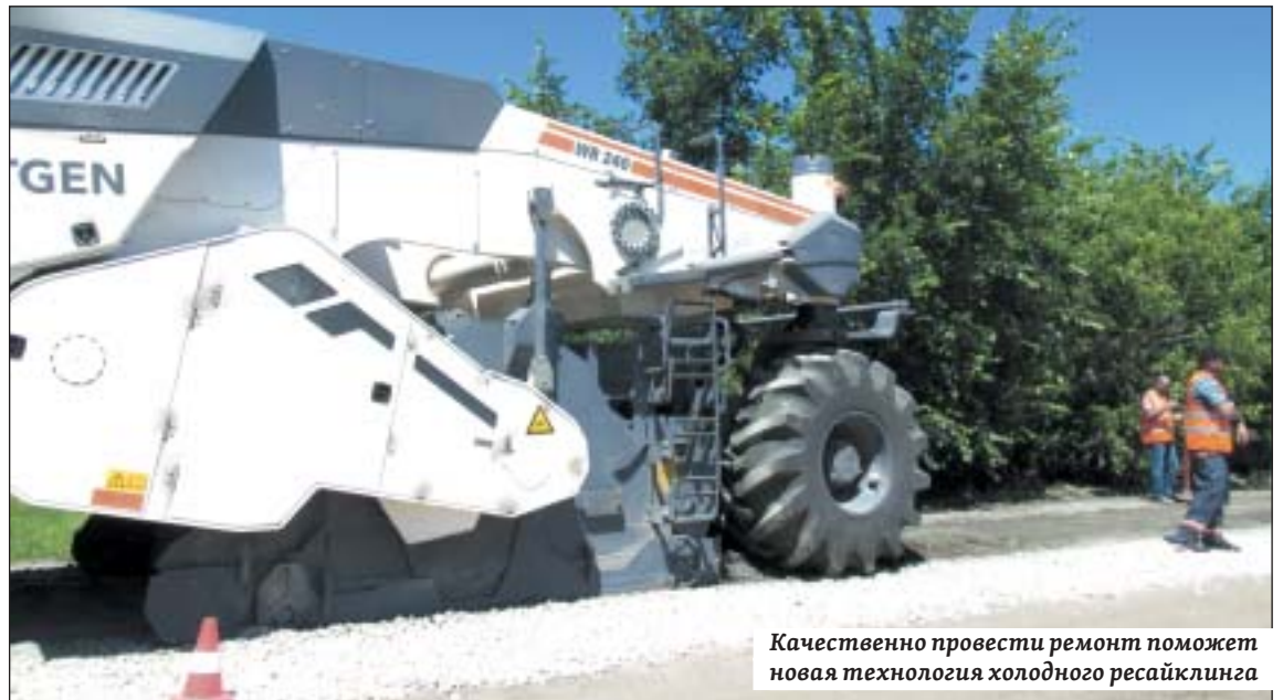
Качественно провести ремонт поможет новая технология холодного ресайклинга

В этом году ремонт продолжился. Чтобы не допустить повторения прошлогодней проблемы, было решено использовать современную техно-