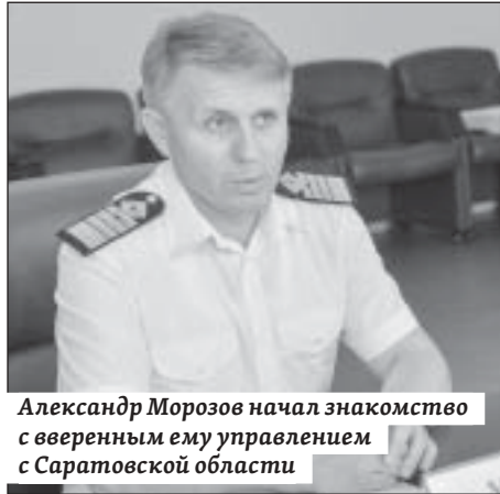
Александр Морозов начал знакомство с вверенным ему управлением с Саратовской области

– На территории области мы во взаимодействии с правоохранительными органами, общественностью ведем работу, направленную на сохранение и развитие биоресурсов, соблюдение вопросов экологической безопасности. Убеж-