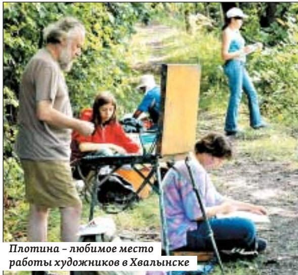
Плотина – любимое место работы художников в Хвалынске

Каждый из участников пленэров чество почитает подарить свою работу галерее. По этим холстам можно выстроить творческий вектор и понять, в каком