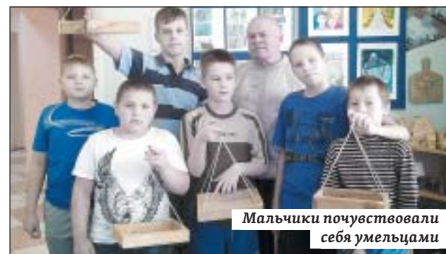
Мальчики почувствовали себя умельцами