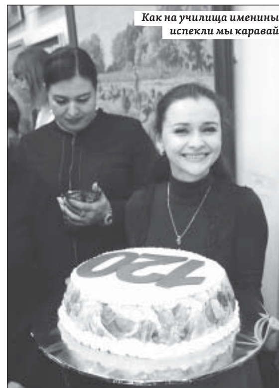
Как на училища именины испекли мы каравай