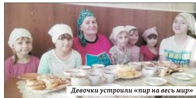
Девочки устроили «пир на весь мир»