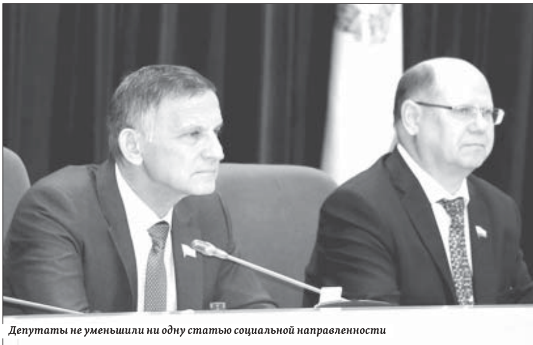
Депутаты не уменьшили ни одну статью социальной направленности