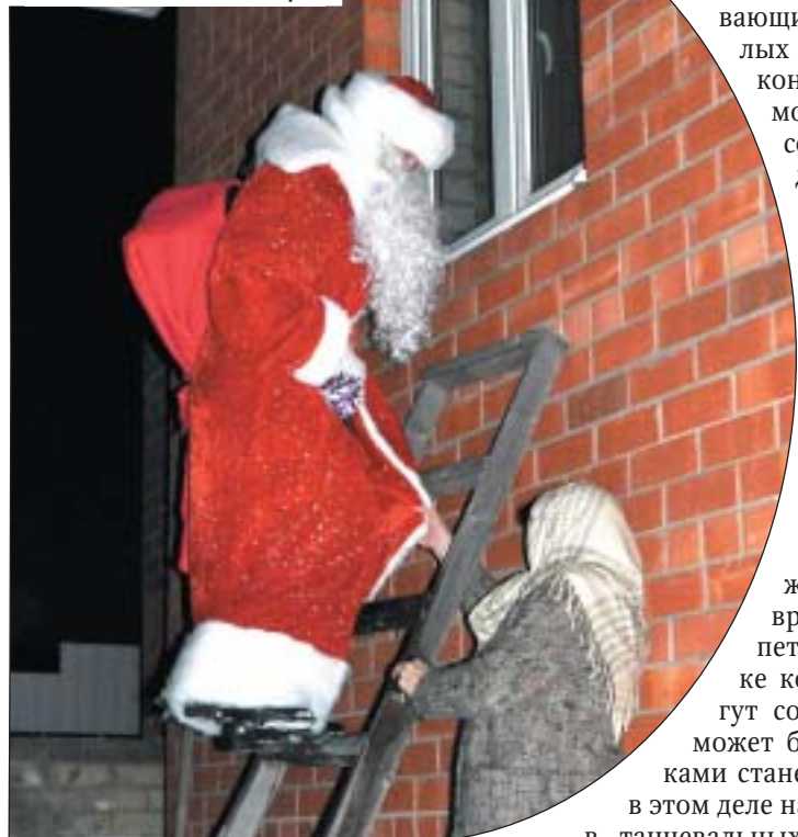
Организуем поздравление знакомых и незнакомых детей в образе Деда Мороза, Снегурочки, снежинок, оленей, эльфов