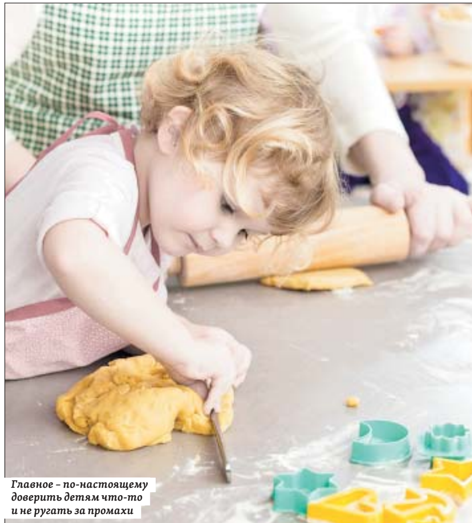
Главное – по-настоящему доверить детям что-то и не ругать за промахи

Если вас уже ждут, то наступило время начинать репетиции! В подготовке концерта вам помогут собственные дети, а может быть, их помощниками станете вы. Пригодятся в этом деле навыки, полученные в танцевальных, гимнастических,